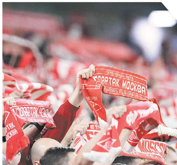
Дарья Исаева «СЭ»

Раскуплены все билеты на один из ключевых матчей весны в РПЛ «Спартак» – ЦСКА, который состоится 26 апреля на «Лукойл Арене»