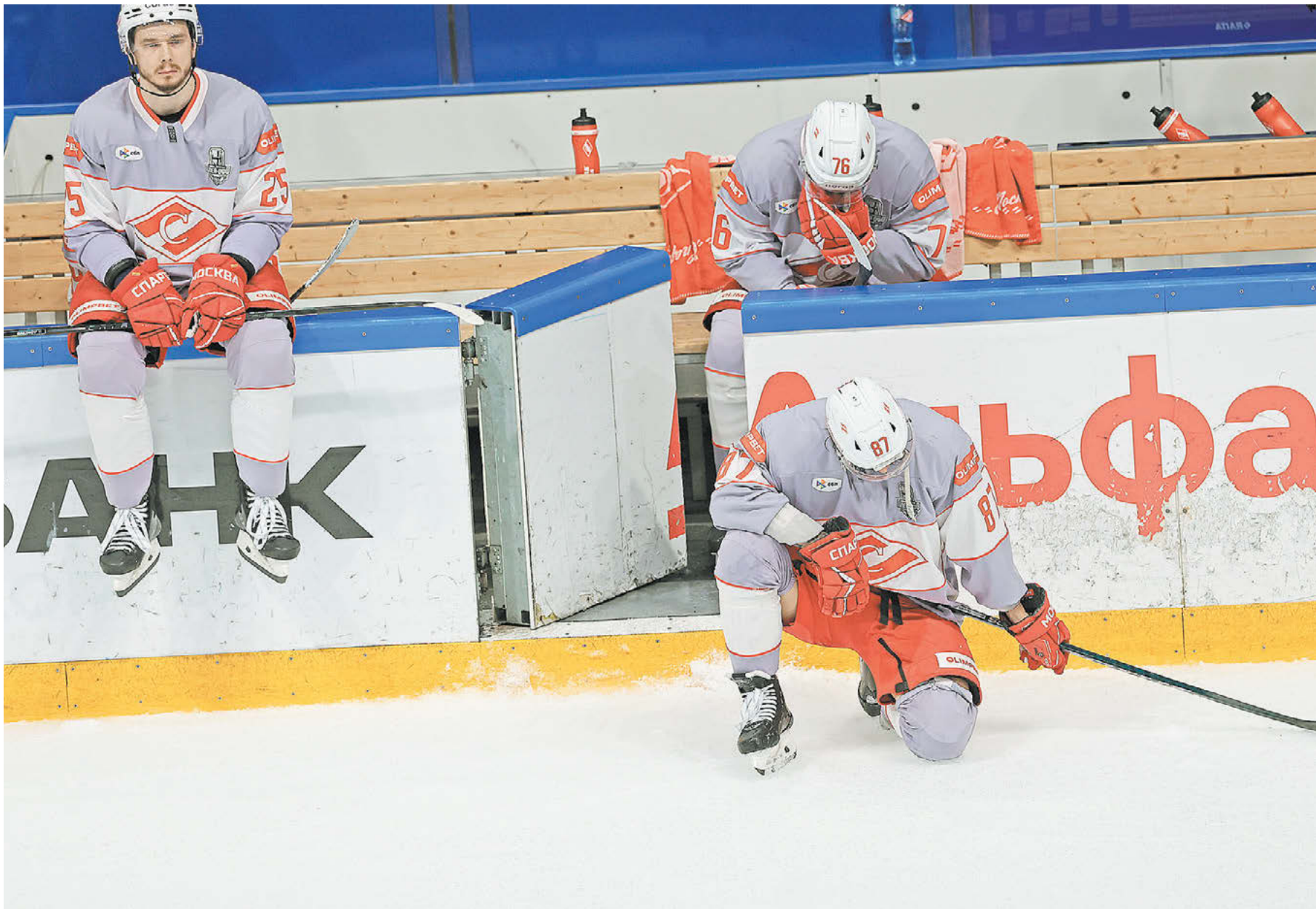
Вчера. Уфа. «Салават Юлаев» – «Спартак» – 3:2. Эмоции красно-белых после поражения