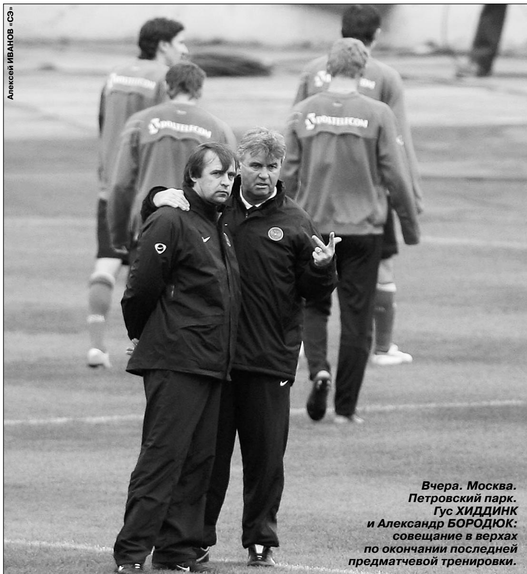
Вчера, Москва. Петровский парк. Гус ХИДДИНК и Александр БОРОДУКОВ: совещание в верхах по окончании последней предматчевой тренировки.

Способна ли сборная спустя месяц после бесцветной ничьей с Хорватией резко прибавить в игре?