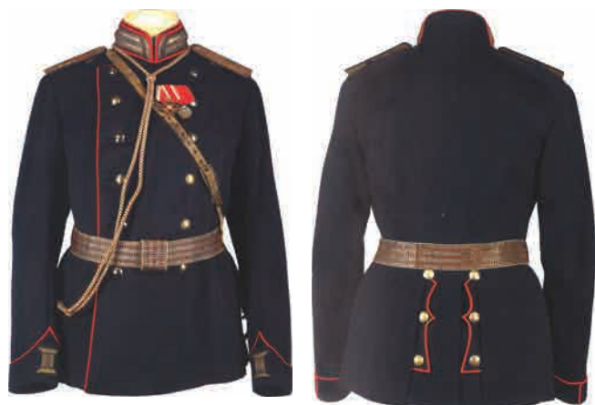
Офицерская форма 10-го Новотроицкого-Екатеринославского полка образца 1897 г. Карманы с выпушкой приборного цвета и тремя пуговицами на каждом

Ментик 2-го лейб-Павлоградского полка специфичного тёмно-зелёного цвета с особым золотым галуном помимо шнура на обшлагах ▼