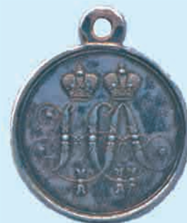
Серебряная медаль «За защиту Севастополя»