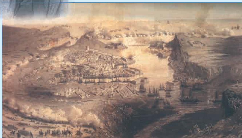
Вид на Севастополь во время бомбардировки 5 (17) октября 1854 г. Художники К. Юбер и А. Виктор. 1860-е годы.

Литография по рисунку, выполненному В.Ф. Тиммом с натуры в Севастополе. 1855 г.