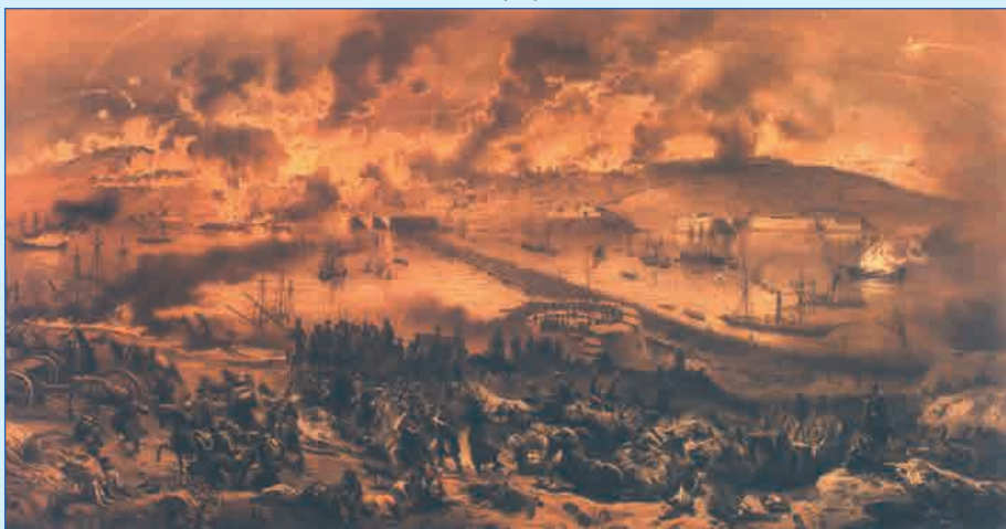
Переход русских войск с южной на северную сторону Севастополя в ночь на 28 августа 1855 г.

Литография по картине Е. Жерара. 1855 г.