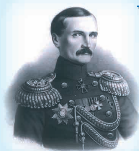
Начальник штаба Черноморского флота генерал-адъютант вице-адмирал В.А. Корнилов Литография. 1858 г.

Г ЕРОИЧЕСКАЯ оборона русскими войсками г. Севастополя – главной базы Черноморского флота России от союзных войск Османской империи и англо-французских войск длилась 349 дней – с 13 (25) сентября 1854 по 27 августа (8 сентября) 1855 года и явилась примером организации активной обороны, основанной на совместных действиях флота и сухопутных войск в защите приморской крепости при тесном огнем взаимодействия корабельной и крепостной артиллерии.