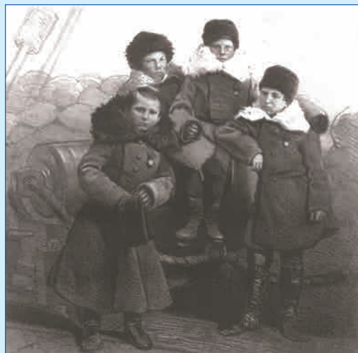
Юнги черноморских флотских экипажей – участники обороны Севастополя

Публикацию подготовила Н.М. ВЕРЕТЕННИКОВА