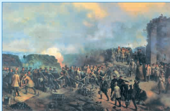
Оборона Малахова кургана Художник Г.Ф. Шукаев. 1856 г.