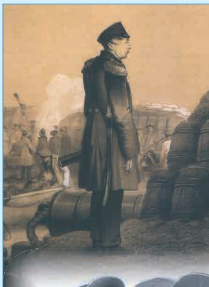
Адмирал П.С. Нахимов на севастопольском бастионе Литография по рисунку с натуры В.Ф. Тимма. 1855 г.

В обороне Севастополя русские войска одними из первых применили на пароходофрегатах искусственный крен, позволивший увеличить угол возвышения орудий, отчего дистанция стрельбы увеличилась с 18 до 25 кабельтовых. Новым в использовании корабельной артиллерии явилась также стрельба по невидимым береговым целям, когда корректировка огня велась корабельными постами, размещёнными на высотах. В методах боевого применения артиллерии содержались элементы артиллерийской контрподготовки, способствовавшей срыву штурмов города противником.