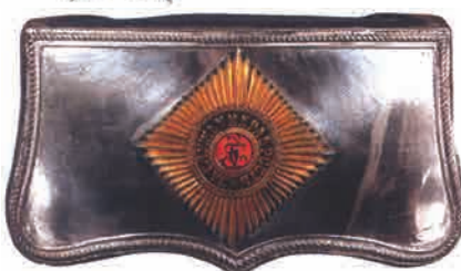
Офицерская лядунка 13-го военного ордена полка со звездой Св. Георгия вместо орла