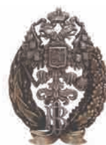
Знак военного врача. Доктор ветеринарных наук