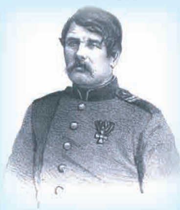
Георгиевские кавалеры Черноморского флота – герои обороны Севастополя