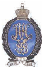
Юбилейный знак Ветеринарной школы. К 100-летию учебного заведения