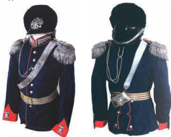
Форма полковника 19-го Архангелогородского полка образца 1908 г. ▲