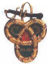
Жетон 9-го гусарского полка

Иллюстрации из кн.: Горохов Ж. Русская императорская кавалерия, Collector's Book, 2008. 366 с., ил.