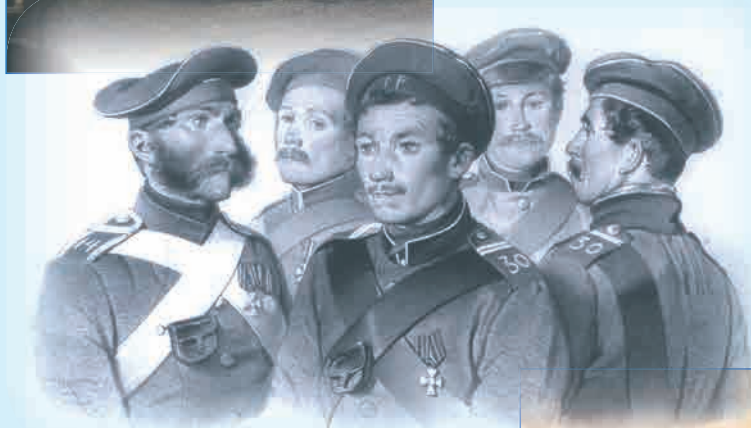
Нижние чины, отличившиеся в вылазках с 3-го отделения оборонительной линии г. Севастополя под начальством лейтенанта Н.А. Бирилёва

Литография по рисунку, выполненному В.Ф. Тиммом с натуры в Севастополе. 1855 г.