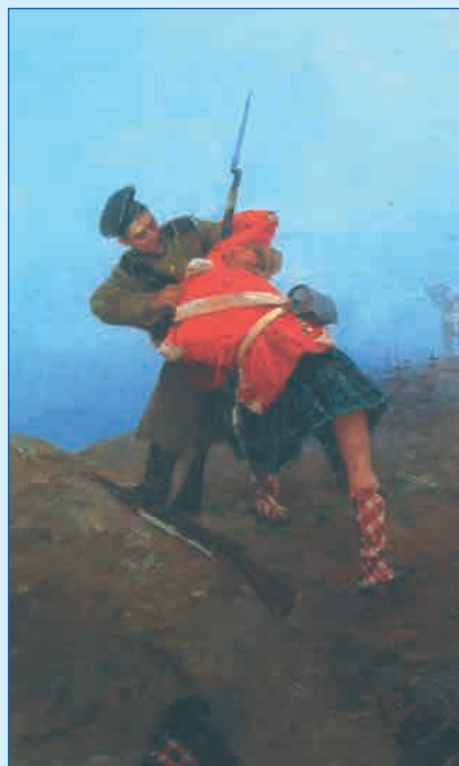
Поединок-схватка русского матроса с шотландским солдатом под Севастополем