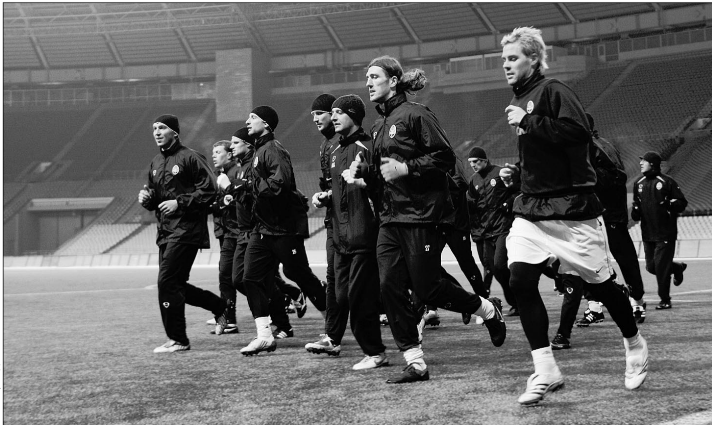
Вчера. Москва. Лужники. Тренировка «Шахтера».

ЦСКА - опытная и уверенная в себе команда, которая к тому же последние четыре года играет практически в неизменном составе. По сравнению с нашими встречами на Кубке Первого канала в Израиле серьезная замена произошла только одна: больше нет Жо, зато появился Дагосен. Неудивительно, что взаимопонимание на поле у