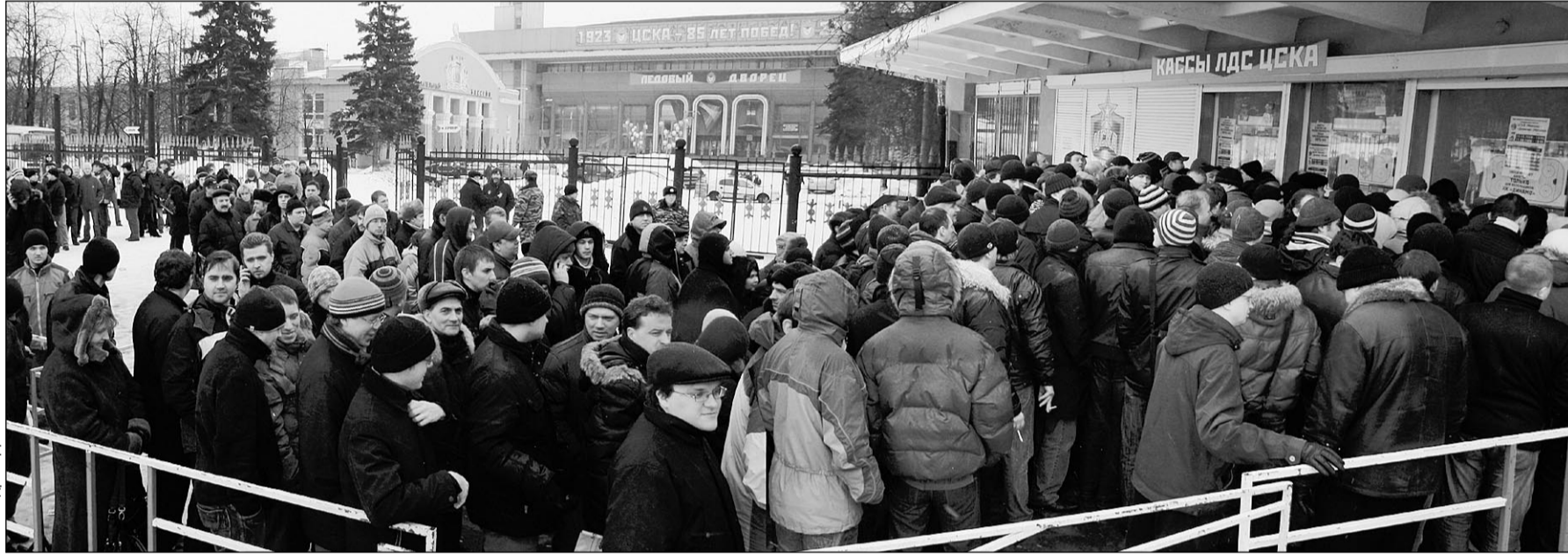
Вчера. Москва. Столпотворение у касс ЛД ЦСКА на Ленинградском проспекте.

В связи с ажиотажем не стоило бы руководителям ХК ЦСКА и «Динамо» договариваться и рассмотреть возможность