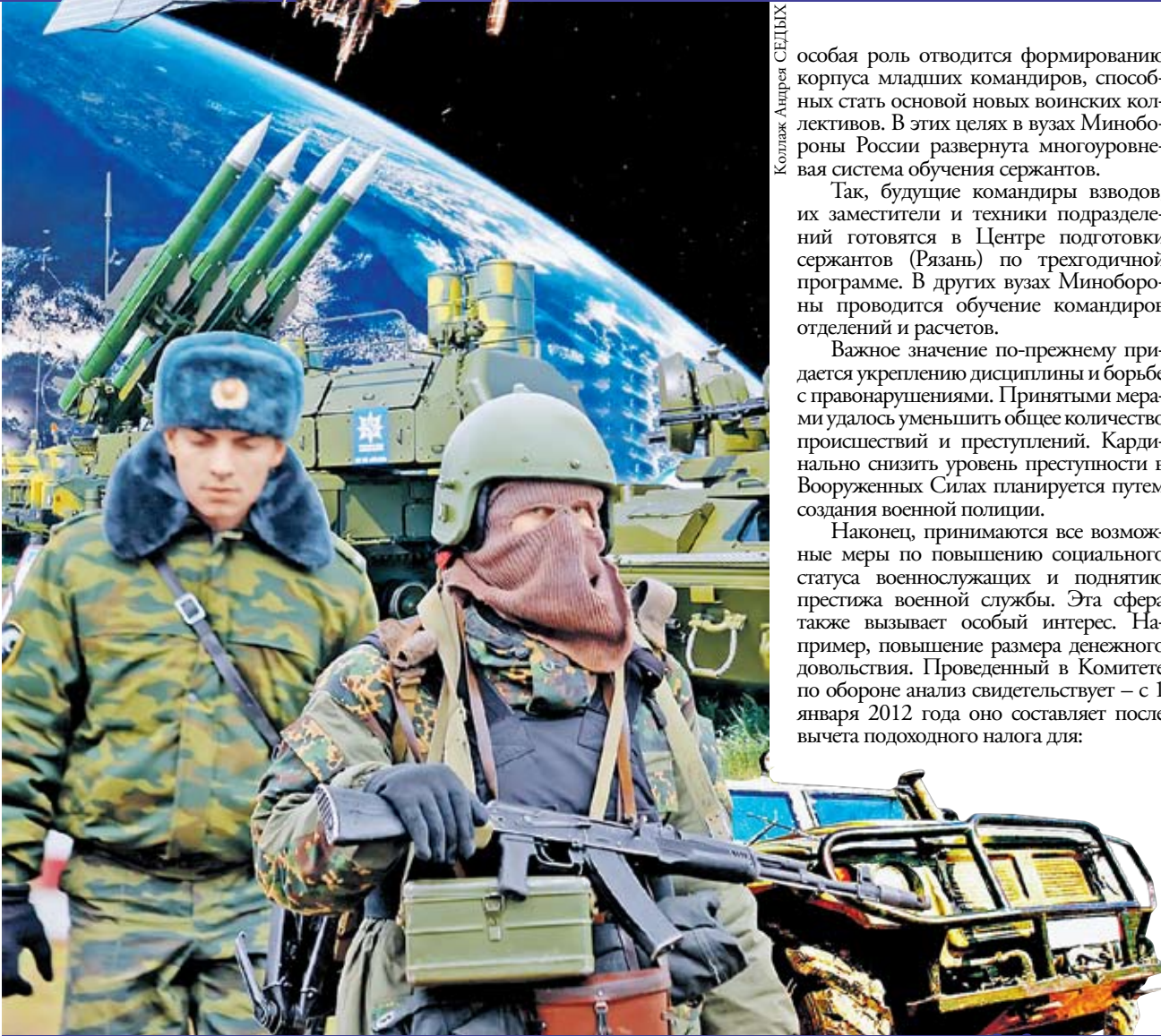
Коллаж: Андрей СЕДУХ

Ведется последовательная работа по качественному повышению уровня боевой подготовки. Создаются учебные центры нового поколения.