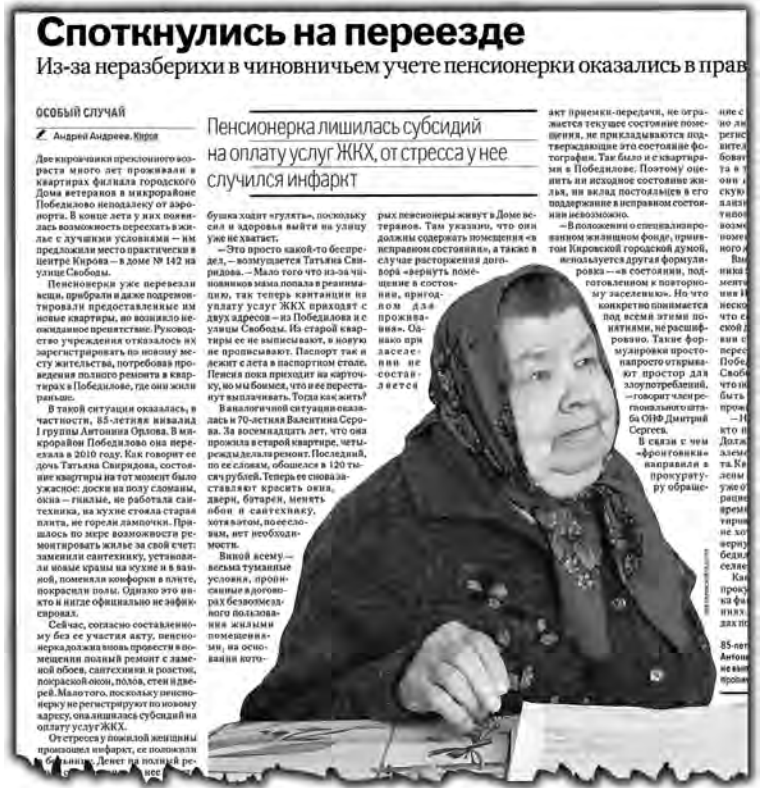
После публикации в «РГ-Неделе» депутаты кировской гордумы решили помочь ветеранам, но внесли еще больше путаницы в документы.