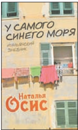
Осис Н. У самого синего моря: Итальянский дневник. М.: Колибри, Азбука-Аттикус, 2011. — 368 с.

4 Пять лет назад Наталья Осис, которую в Москве знали как драматурга, театрального критика и переводчика, покинула столицу, чтобы жить на родине мужа-итальянца, в Генуе. Где люди так много и громко говорят, вечно пьют кофе и оценивают человека по положению персиан (ставней). Об этом ее книга, написанная наблюдательной русской, ставшей вдруг генуэзской синьорой.