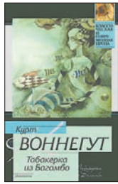
Воннегут К. Табакерка из Багомбо / Пер. с англ. М.: АСТ, 2011. — 352 с.