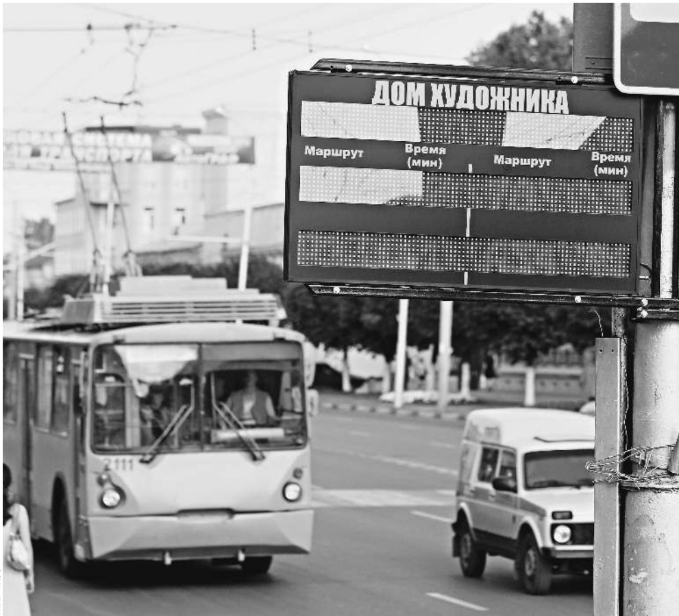
Эксперименты по использованию ГЛОНАСС на транспорте дали положительный результат

Для пассажирского транспорта это означает отсрочку на один год. По идее все автобусы (в том числе «Газели»), троллейбусы, железнодорожные вагоны, бензовозы и ряд других категорий должны были быть оснащены требуемым оборудованием к 1 января 2012 года. Во всяком случае, к этой дате перевозчикам было приказано готовиться, а Госавтонадзор (структура Ространснадзора) с начала этого года прекратил выдачу лицензий на пассажирские перевозки тем, кто сигналы ГЛОНАСС не принимает. С июля 2012 года Госавтонадзор обещал лишить таких лицензий всех, кто не установит навигационную аппаратуру. Заместитель начальника Северо-