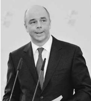
Министр финансов старается тратить равномерно