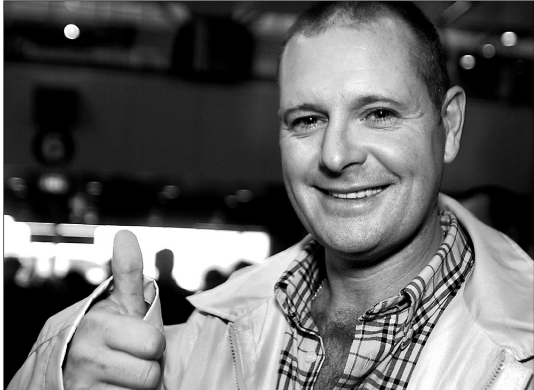
Не исключено, что Пол ГАСКОЙН именно так отреагирует на известие о том, что к его колоритной персоне проявляет интерес «Торпедо-ЗИЛ».

После того как весной прошлого года из-за ссоры с тренером Пол Гаскойн ушел из клуба