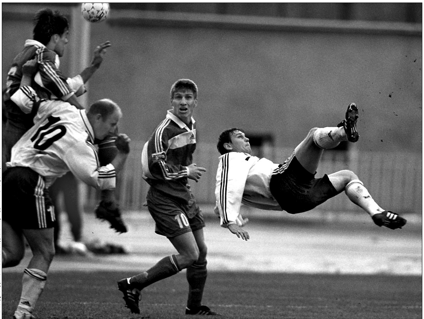
Вчера. Москва. Стадион «Торпедо» имени Э. Стрельцова. «Торпедо-ЗИЛ» - «Шинник» - 0:0.

В следующем туре, 22 апреля, встречаются: Балтика - Спартак-Чукотка, Локомотив СПб - Рубин, Спартак - Носта, Жемчужина - Лада, Амур - Локомотив Ч, Газовик-Газпром - Металлург Кр, Металлург Лп - Волгарь-Газпром, Арсенал - Сокол, Торпедо-ЗИЛ - Кристалл, Томь - Шинник.