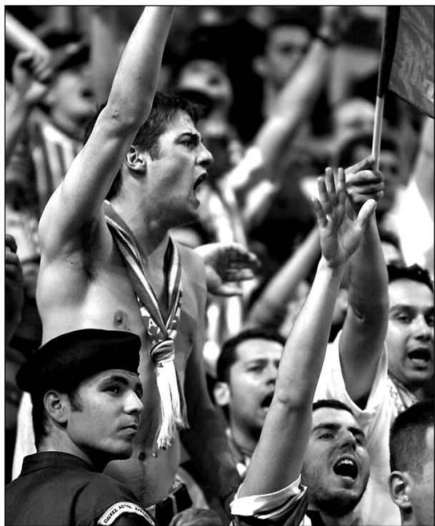
Вторник. Салоники. Каждый занят своим делом - и полиция, и болельщики.