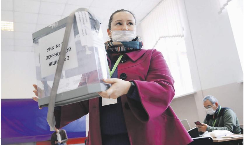
Андрей Златов / Известия