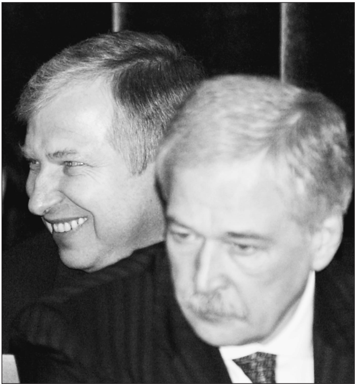
Виктор Черкесов и Борис Грызлов теперь главные борцы с наркомафией и неуплатой налогов

По словам председателя ГКПН, штат оперативного блока нового комитета составит около 15 тысяч человек — в новой спецслужбе оперативников будет ровно в 2 раза больше, чем в бывшем Главном управлении по борьбе с незаконным оборотом наркотиков (ГУБНОН МВД). Даже при полном переходе сотрудников ГУБНОНа из МВД в новое ведомство там образуется огромный некомплект. Его восполнят за счет бывших оперативников налоговой полиции. Как они будут осваивать тонкости