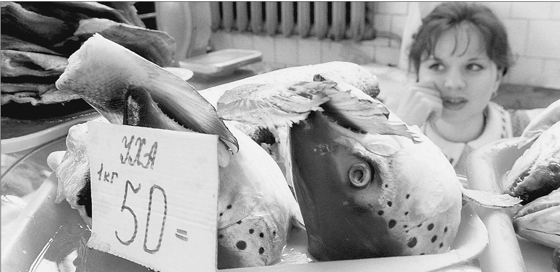
Дешевая уха из радиоактивной рыбы дорого обходится челябичанам

— Откуда пельдь? — спрашиваю у торговцев. Хитро отвечают: из