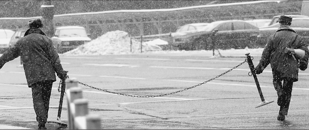
Установка оцепления на месте взрыва