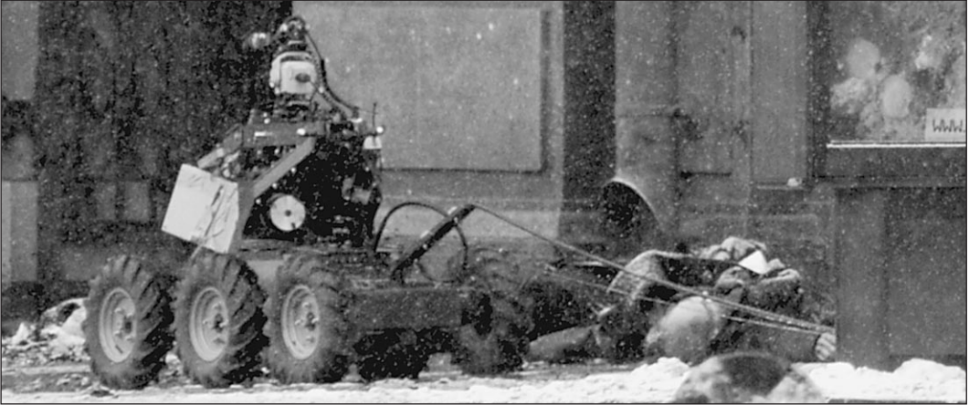
Робот уничтожает подозрительный дипломат

Вместе с тем спустя 2 часа после взрыва правоохранительные органы объявили в розыск причастную к теракту женщину. Это худощавая женщина 40–45 лет с кавказским типом лица, рост 160 сантиметров. Одета в черную шубу до пят и черную шапку. Какова ее роль в этом теракте — пока не ясно. Возможно, она сопровождала шахидок на некотором удалении и привела в действие взрывное устройство с помощью дистанционного управления.