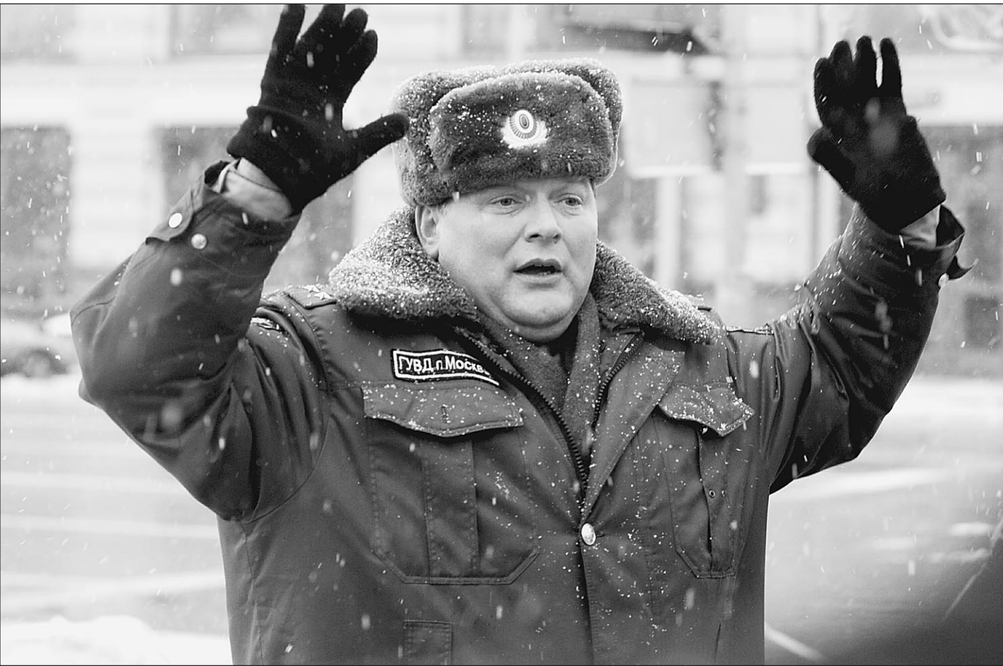
9 декабря. Москва. На месте взрыва у гостиницы «Националь»