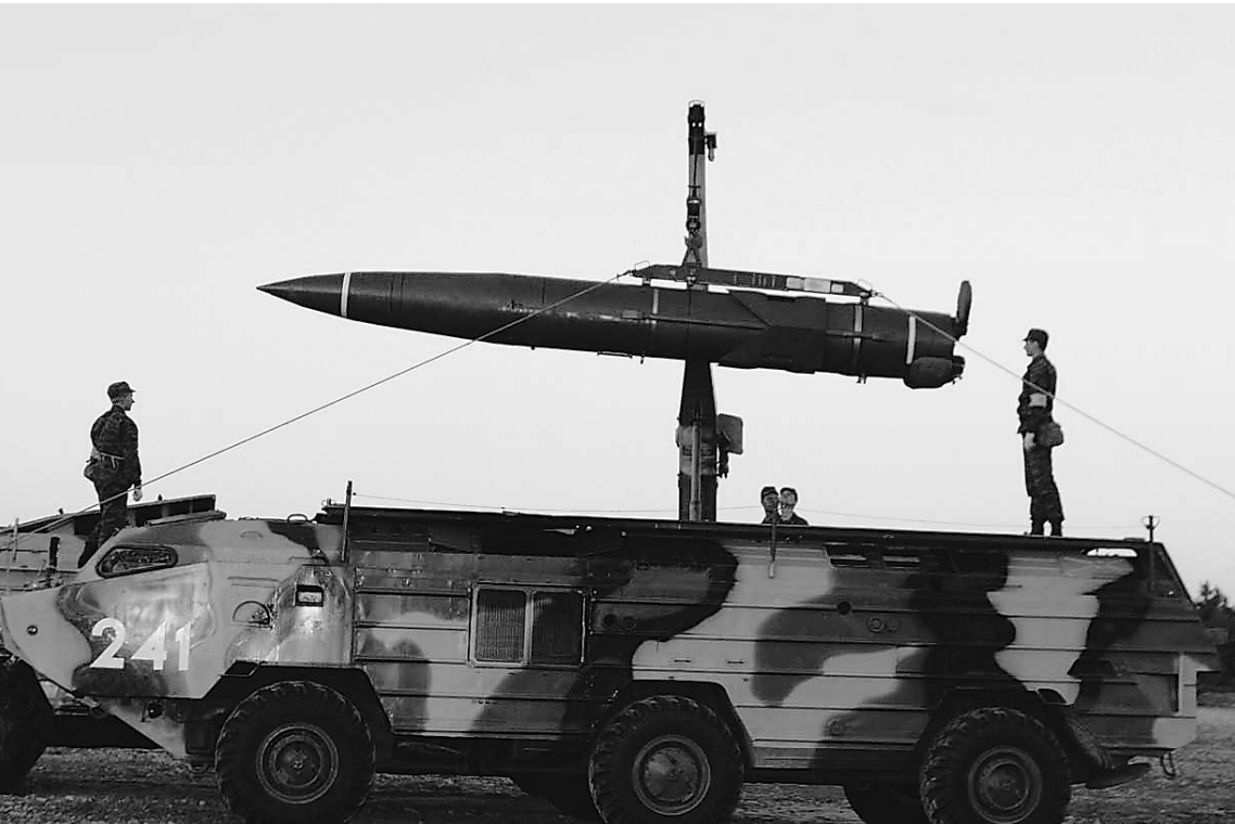
Оперативно-тактический ракетный комплекс «Точка-У» способен поражать на расстоянии от 15 до 120 километров

ОФИЦИАЛЬНЫЕ (ЦЕНТРАЛЬНЫЙ БАНК РФ) КУРСЫ ВАЛЮТ К РУБЛЮ НА 26 ЯНВАРЯ