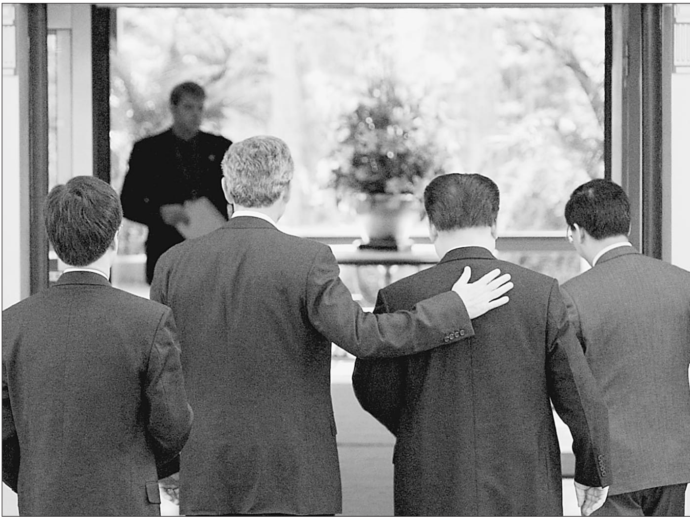
Буш (второй слева) и Цзян Цзэминь (с рукой Буша на спине) после совместной пресс-конференции в Шанхае

Сейчас декларация по терроризму сомнений не вызвала ни у кого. На саммите вообще самыми употребляемыми словами стали «угроза» (терактов), «вызов» (мировой экономике), «безопасность» (ее же), «ужесточение» (контроля за деньгами, которые могут питать террор). В