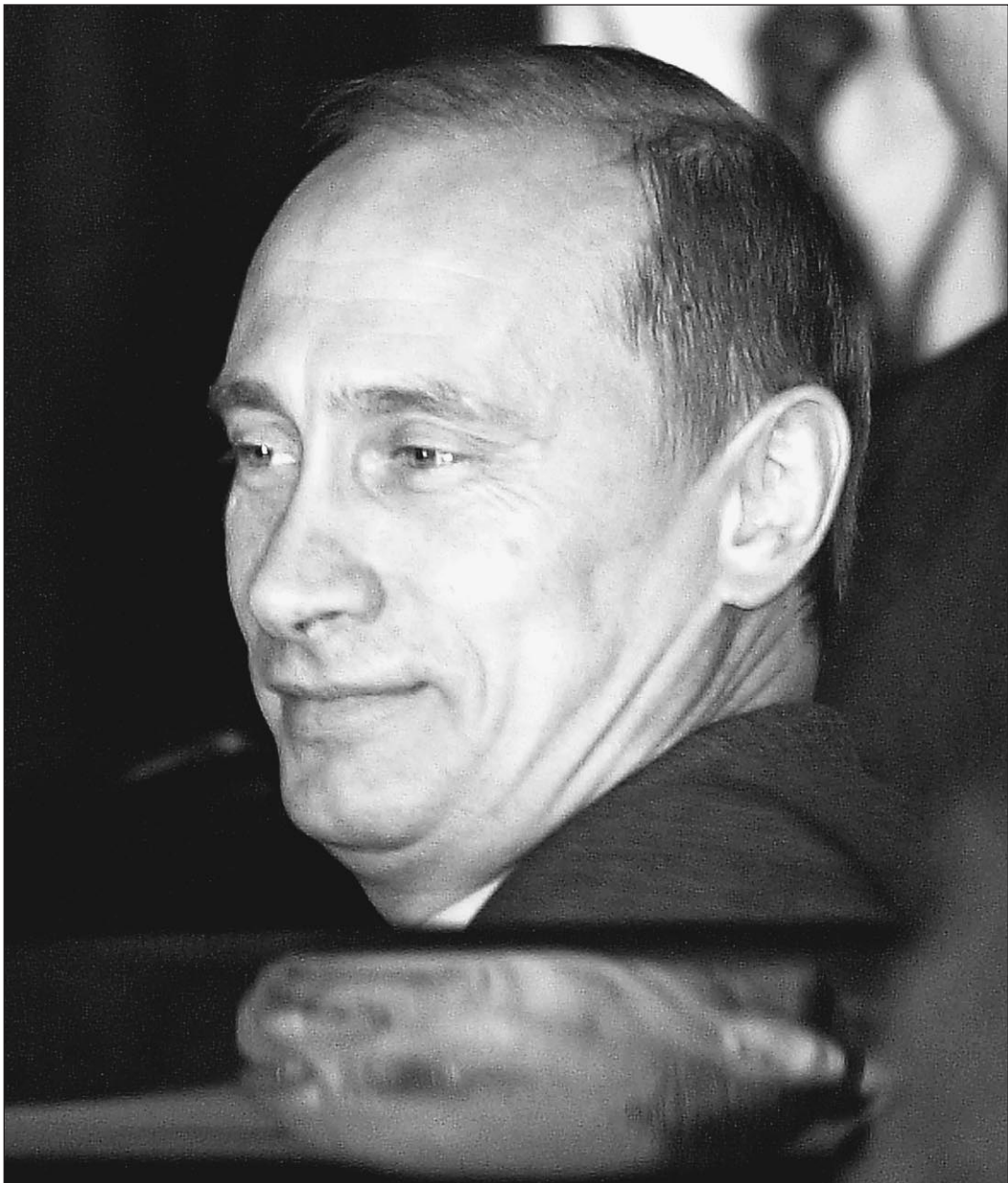
Путин в Шанхае

Шанхай — первая зарубежная поездка Буша после 11 сентября. Перед отъездом он сказал, что покидает страну в трудное время, но «международные отношения — важный фактор, позволя-