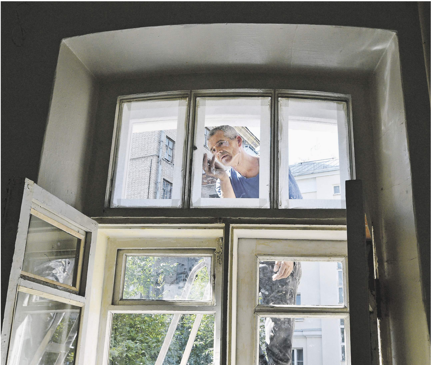
Данил Каскин / Известия