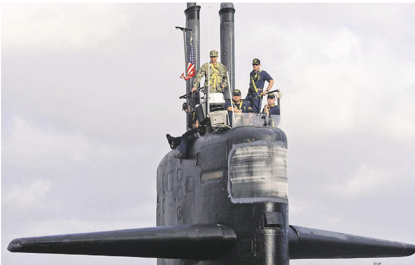
Американские АПЛ в последние годы стали чаще появляться в прибрежных водах Норвегии (на фото — подлодка типа «Лос-Анджелес»)