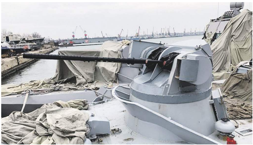
Боевой модуль «Катран-М» катера «Бердянский»

Боевые модули (БМ) «Катран-М» позиционируются Киевом как одни из самых современных в мире дистанционно управляемых систем. Изготавливаются они полностью из украинских комплектующих. Но, как показала фото- и видеосъемка, сделанная после того, как катера были отбуксированы российскими моряками в Керчь, «Катран-М» собран на низком технологическом уровне и из некачественных материалов. 03 →