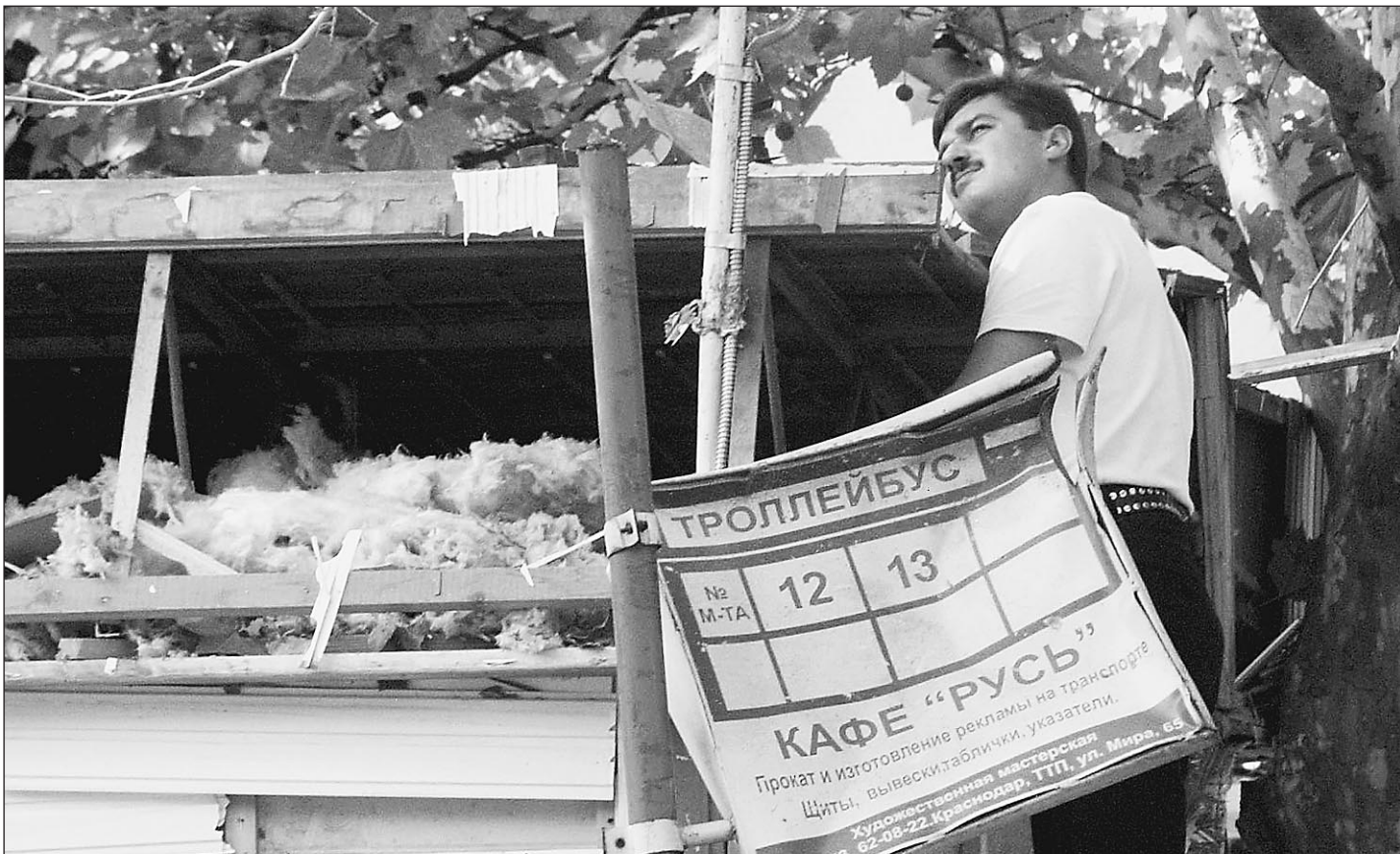
25 августа. Краснодар. Улица Трудовой Славы. На месте взрыва

Вчера в Краснодаре на трех автобусных остановках практически одновременно прогремели взрывы. Бомбы были заложены на крыши остановочных конструкций, их таймеры были установлены на половину восьмого. Один человек погиб на месте, еще двое скончались в больнице. Семнадцать человек ранены. В правоохранительных органах склоняются к тому, что это был спланированный теракт: на остановках наземного транспорта в Краснодаре традиционно собирается много пассажиров. К счастью, вчера погода в Краснодаре была ясная и солнечная, не было дождя, и людям не пришлось прятаться под пластиковыми крышами остановок. Именно это и спасло многим жизнь.