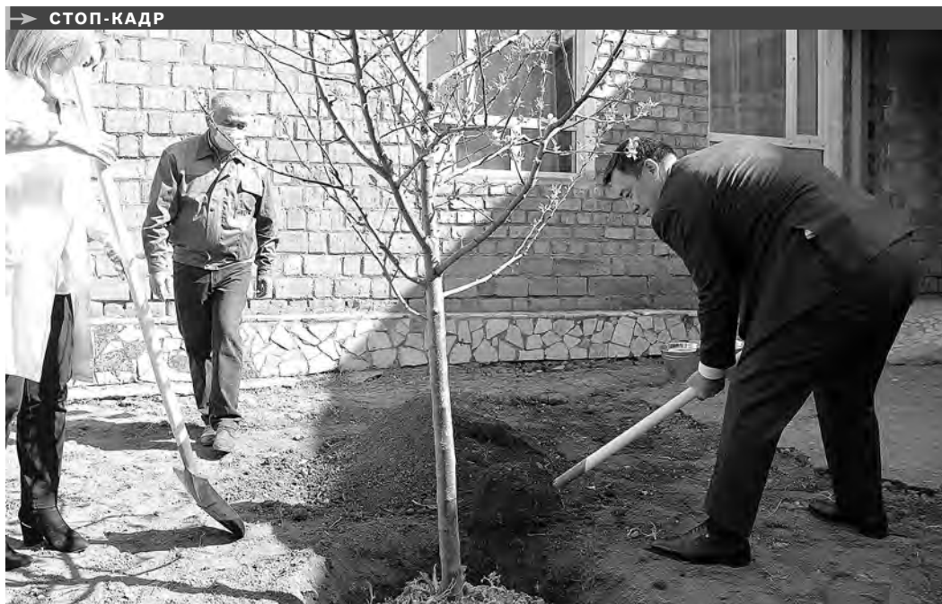
ПРЕСС-СЛУЖБА ПРЕЗИДЕНТА КР

ГЛАВНОЕ управление МВД по Москве выяснило, из каких стран в столицу РФ чаще всего приезжают мигранты. По данным ведомства, на сегодня в Первопрестольной насчитывается 789 тысяч иностранных граждан. Большая их часть — граждане Киргизии. Их около тридцати процентов от общего числа мигрантов. Основная их масса приехала для трудоустройства.