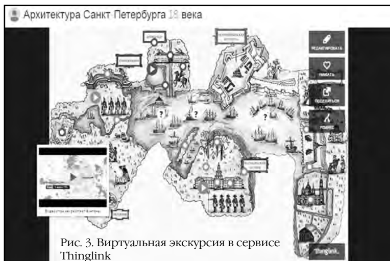
Рис. 3. Виртуальная экскурсия в сервисе Thinglink

Очень интересная получится экскурсия, если в нее будут включены рассказы очевидцев, записанные школьниками, снятое видео.