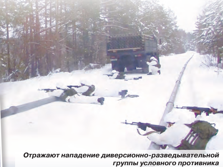
Отражают нападение диверсионно-разведывательной группы условного противника