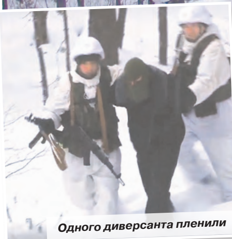
Одного диверсанта пленили