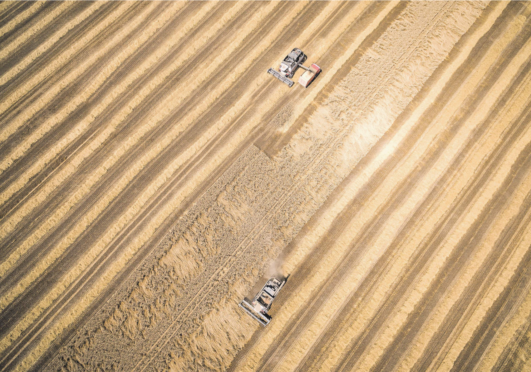
В прошлом году было собрано более 134 млн т зерна

«Страну — получателя российской продовольственной помощи, сроки