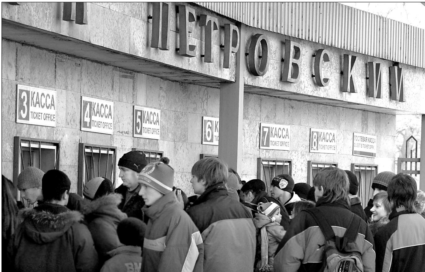
Вчера. Санкт-Петербург. В преддверии матча с «Русенборгом» болельщики «Зенита» штурмуют кассы «Петровского».

О готовности города и стадиона «Петровский» к матчу с норвежцами - стр. 2