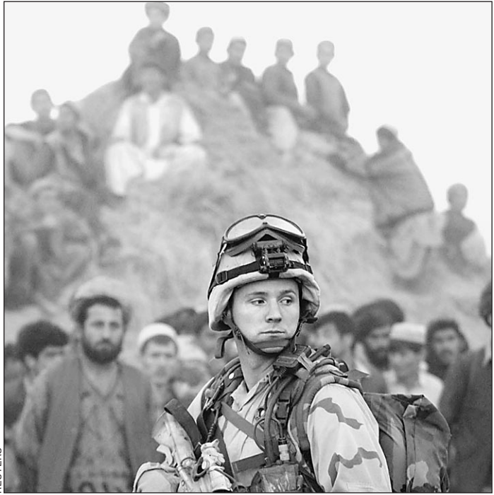
Американский спецназовец — участник операции «Стремительная свобода»