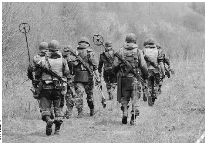
Разминирование всей территории Чечни и Ингушетии оказалось непосильным для Минобороны

Как рассказал «Известиям» источник в Министерстве обороны, еще в 2010 году тогдашний президент России Дмитрий Медведев поручил Министерству обороны ускорить процесс разминирования земель Северного Кавказа. Однако большая часть взрывоопасных земель до сих пор остается неочищенной. — В Чечне надо очистить от мин более 14 тыс. га сельскохозяйственных земель, — пояснил высокопоставленный собеседник. — Однако расчеты показывают, что за четыре года наши инженерно-саперные подразделения смогут своими силами разминировать только 1833,6 га. — Это всего 12% от общей площади. Но уже сейчас для этого нужно 346 млн рублей, а в последующие три года еще более 1 млрд рублей.