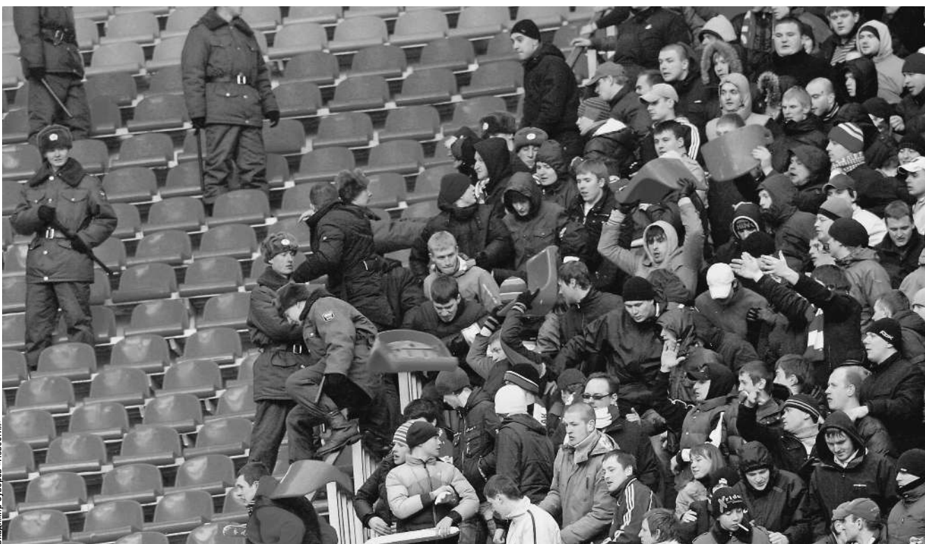
Беспорядки на стадионах стали настолько распространенными, что заставило законодателей задуматься о внесении изменений в действующий закон о спорте