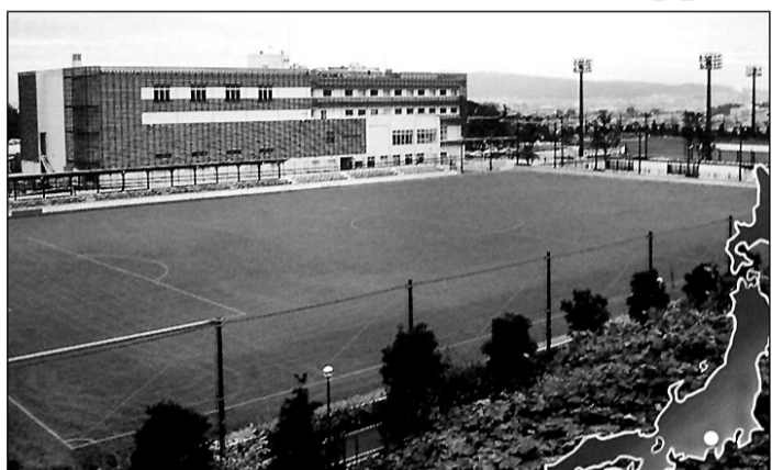
Тренировочный центр Симидзу станет базовым лагерем сборной России.