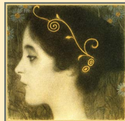
Густав Климт «JUNIUS», фрагмент

Остاپовский проезд, 3, стр. 27 Тел.: (495) 937-13-21 expo@ki-expo.ru www.ki-expo.ru