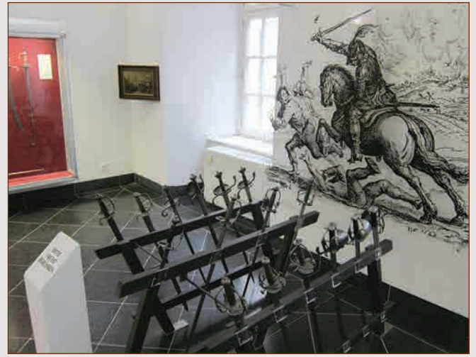
▲ Зал эпохи Тридцатилетней войны ▲