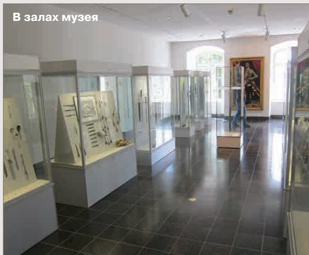
В залах музея