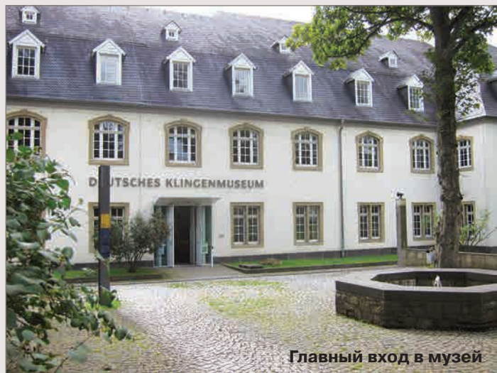
Главный вход в музей