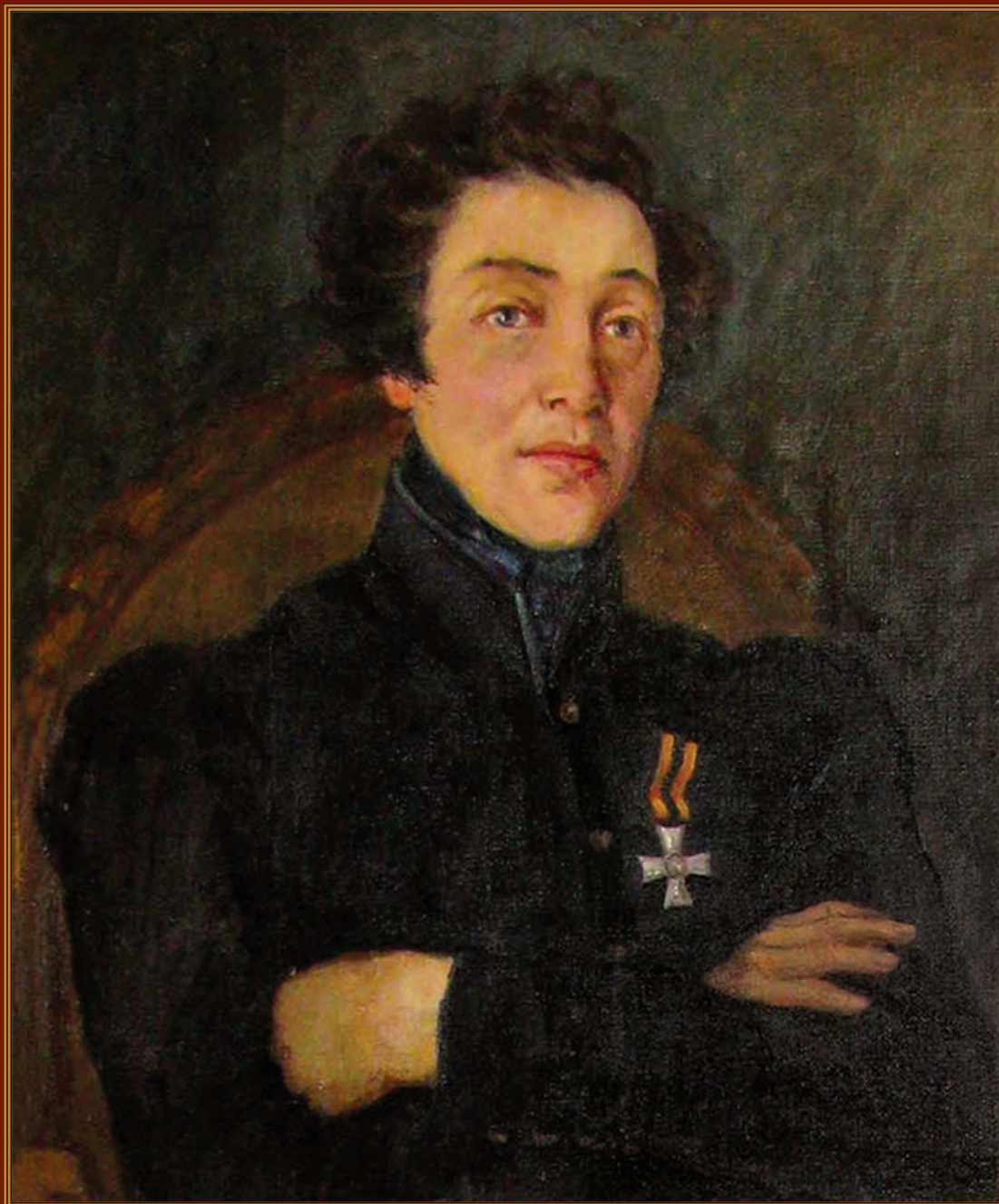
Портрет Н.А. Дуровой Художник В.И. Куделькин, 1953 г. Музей-усадьба Н.А. Дуровой, г. Елабуга (Республика Татарстан)