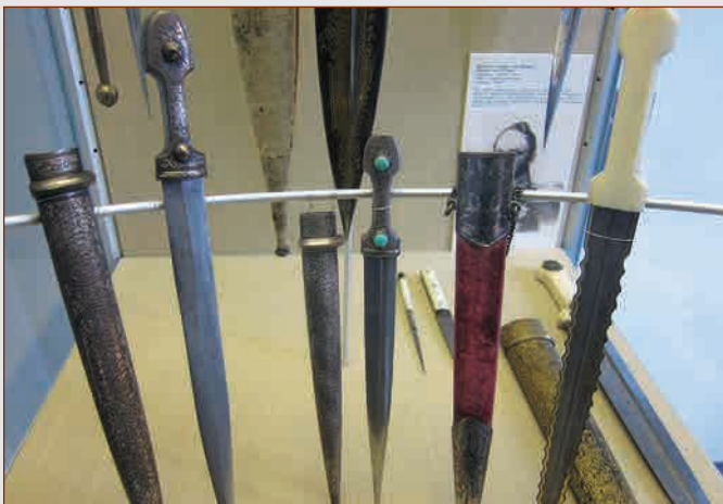
▲ Клинки кавказских мастеров ▼