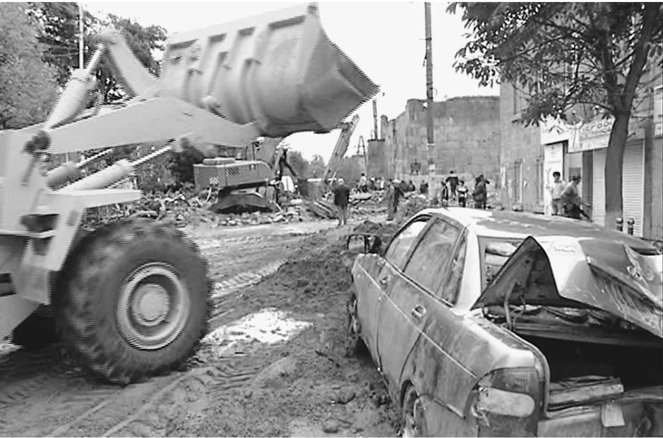
Для ликвидации последствий схода селя сразу была задействована тяжелая техника