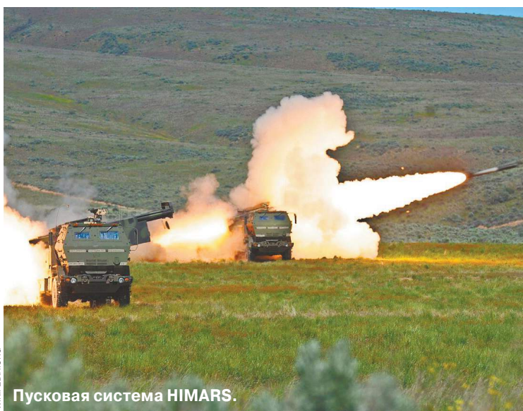
Пусковая система HIMARS.