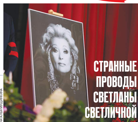
Места у микрофона заняли светские львицы, никак не связанные с актрисой