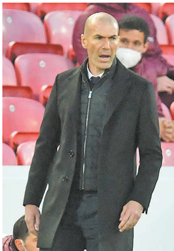
Вчера. Ливерпуль. «Ливерпуль» – «Реал» – 0:0. Главный тренер мадридцев Зинедин Зидан

ФУТБОЛ // Лига чемпионов. 1/4 финала. Ответные матчи