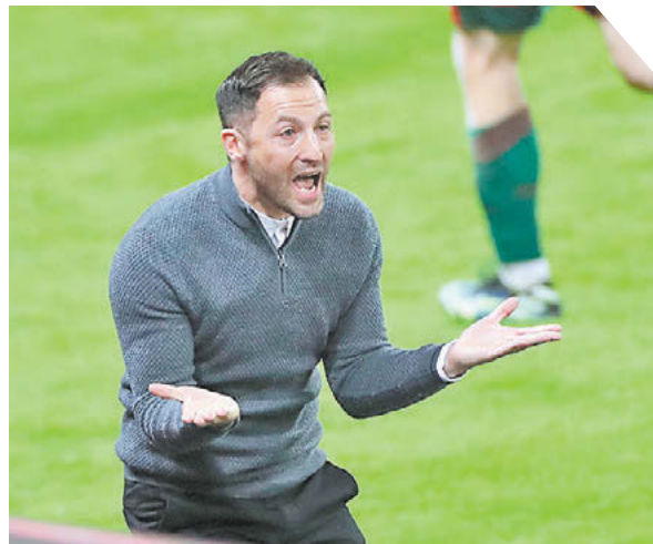
Александр Федоров «СЗ» / Canon EOS-1DX Mark II