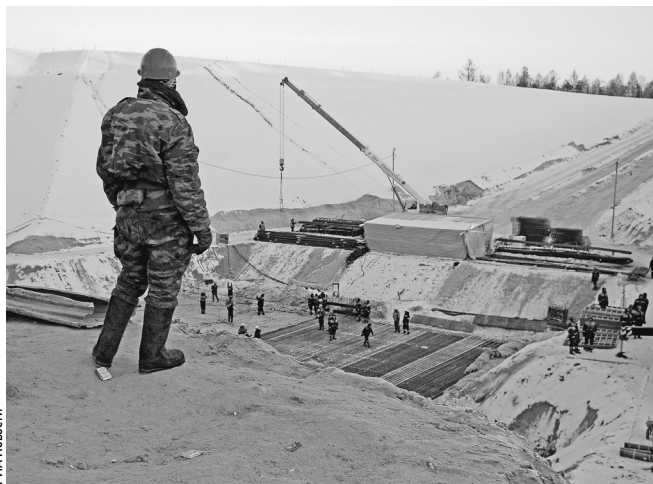
Условия строительства на Дальнем Востоке непростые

Базовый вариант подразумевает мирный характер отношений с Казахстаном, на фоне которых Россия продолжает инвестировать в развитие инфраструктуры комплекса. В этом случае к 2018 году стартовый комплекс для носителей «Зенит» дооборудуется для отработки беспилотных (то есть испытательных) запусков нового пилотируемого корабля, который сей-