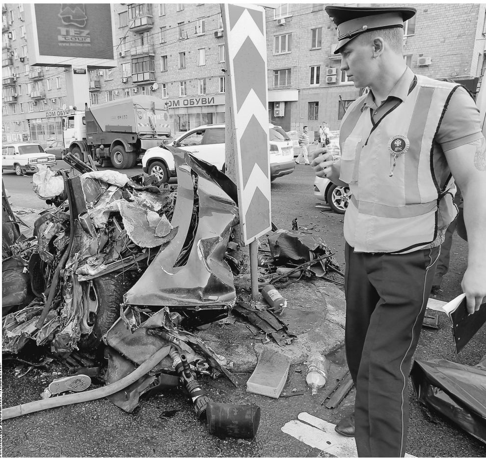
Некоторые страшные аварии можно было предотвратить, улучшив состояние дорог