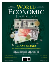
#6 (16) Illustration by Oleg Babkin