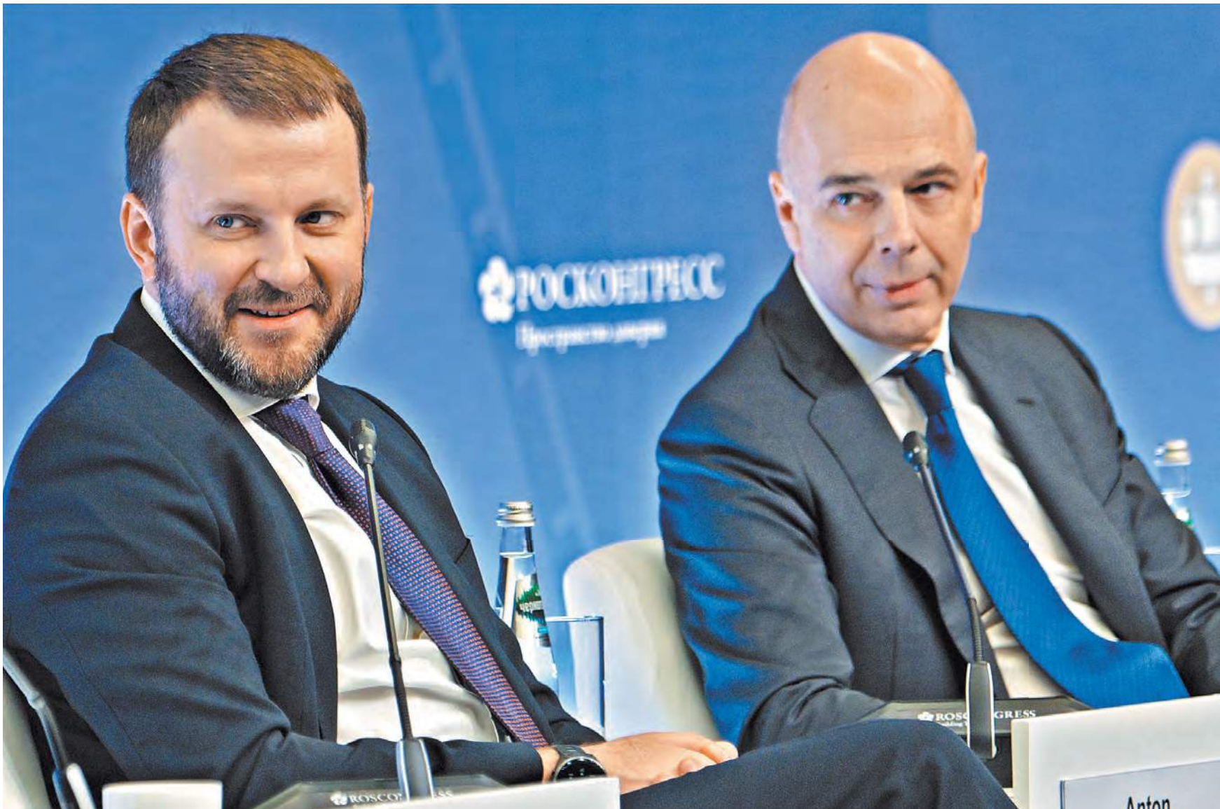
Максим Орешкин и Антон Силуанов: Россия должна обеспечить себе суверенитет по целому ряду направлений.

По его словам, власти также научились лучше управлять бюджетными деньгами. «Понимая, что не столько касса, как раньше было, а какой результат. Такая система целеполагания, система ответственности, система показателей за использование каждого рубля была выстроена последние годы. Она работает», — отметил Силуанов. Кроме того, власти начали лучше собирать деньги в бюджет, добавил он. «Посмотрите, как работает налоговая служба и какие изменения произошли за последние годы», — сказал Силуанов. Кстати, как отметил в интервью телеканалу «Россия 24» на ПМЭФ глава Федеральной налоговой службы (ФНС)