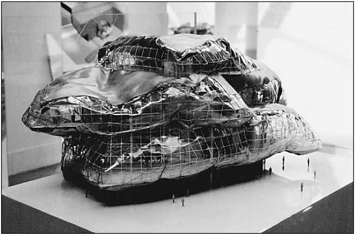
Новое здание Мариинского театра, каким видит его Эрик Мосс