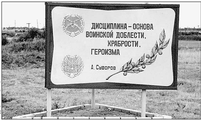
Агитплакат военной части № 20004, из которой сбежали 54 срочника