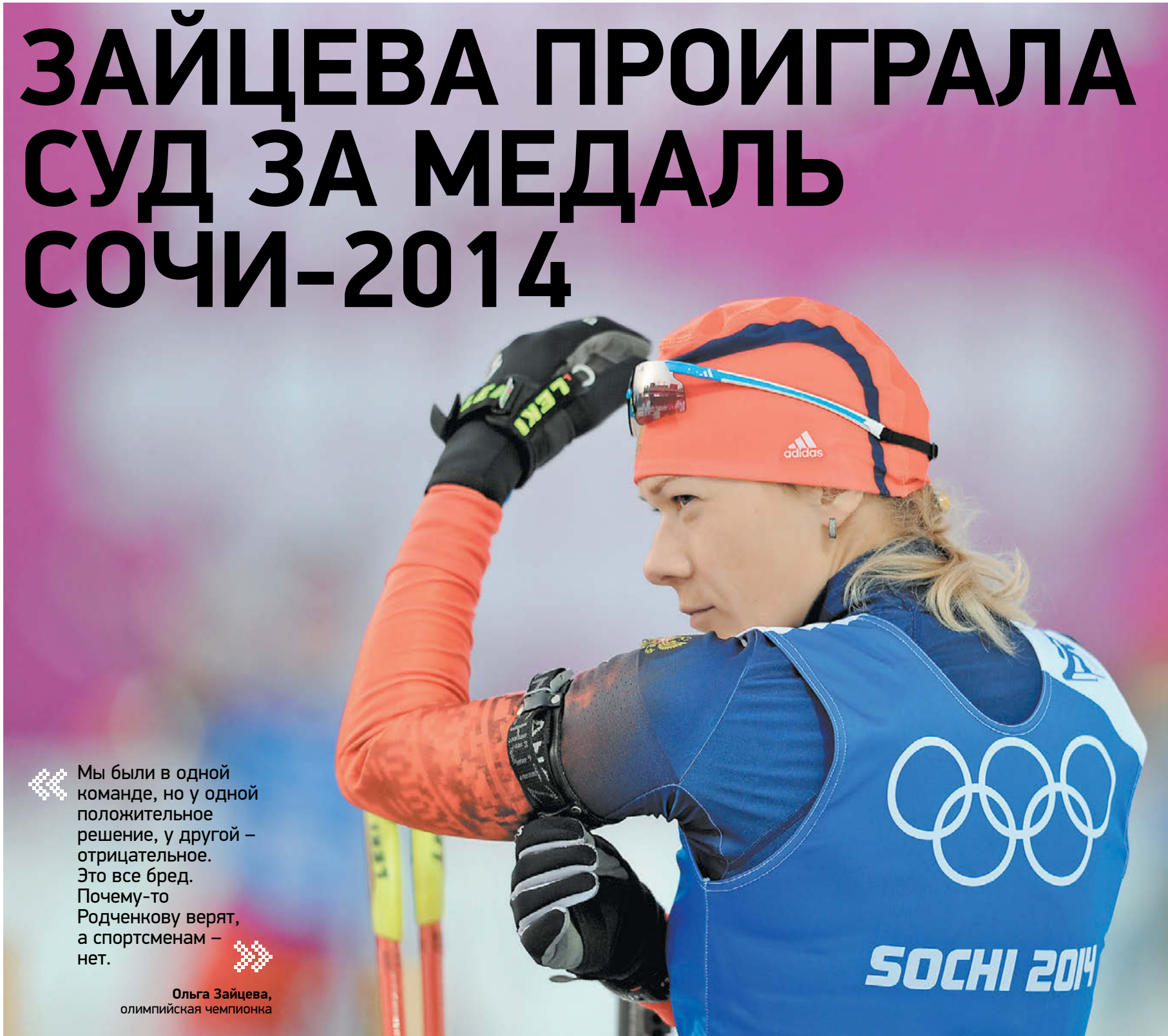
20 февраля 2014 года. Сочи. Ольга Зайцева

Женская сборная России окончательно лишена эстафетного серебра домашней Олимпиады, несмотря на то, что две участницы забега – Яна Романова и Ольга Вилухина – оправданы Спортивным арбитражным судом