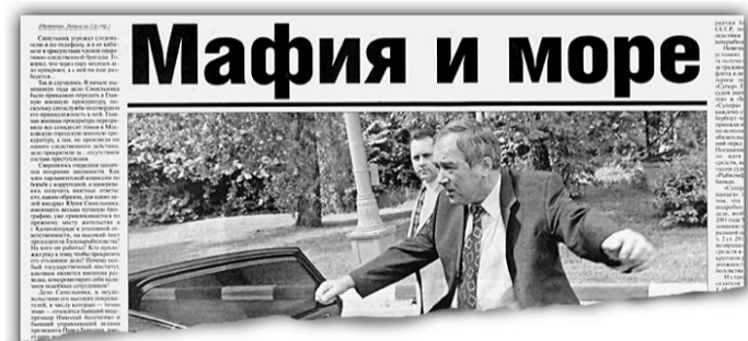
«Известия» № 125

пределяться между местными предприятиями решениями региональных властей. После этого квоты направляются Наздратенко на утверждение. Однако глава Госкомрыболовства отказался утвердить предложенный регионами раздел, настаивая на исключении некоторых фирм и соответственно включении других. В итоге в течение полутора месяцев рыбаки не могли приступить к вылову, например, минтая, в то время как сезон лова заканчивается уже 1 апреля.