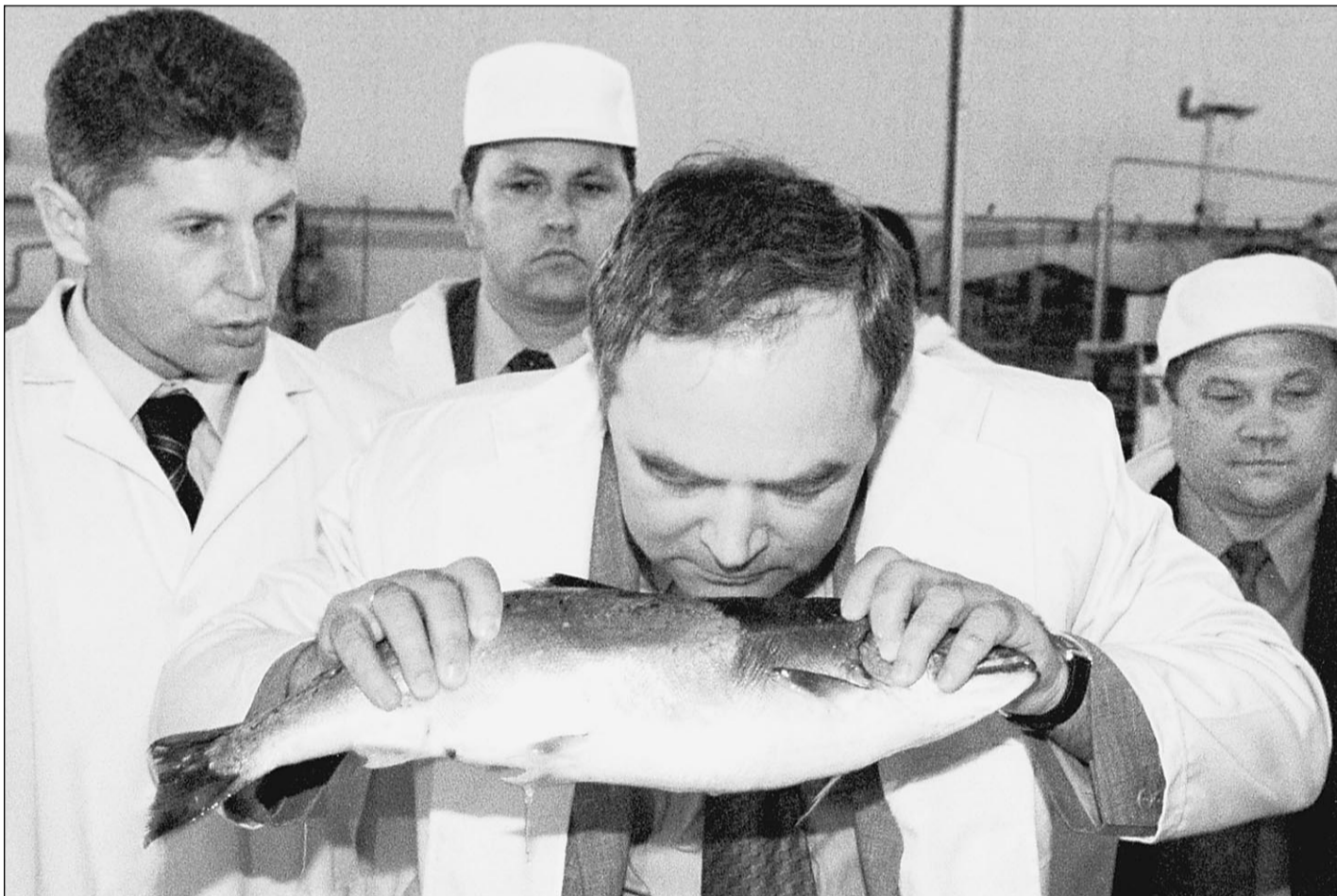
Есть рыболовы и получше

Одновременно с отстранением Евгения Наздратенко от исполнения обязанностей Михаил Касьянов отменил два его приказа о распределении промышленных квот на Дальнем Востоке. Как объяснил премьер, именно распределение квот в Приморье и Магаданской области стало причиной принятых вчера решений. По словам Касьянова, все необходимые документы по квотам были подписаны правительством еще 31 декабря прошлого года, но лицензий на вылов рыбы на Дальнем Востоке до сих пор не