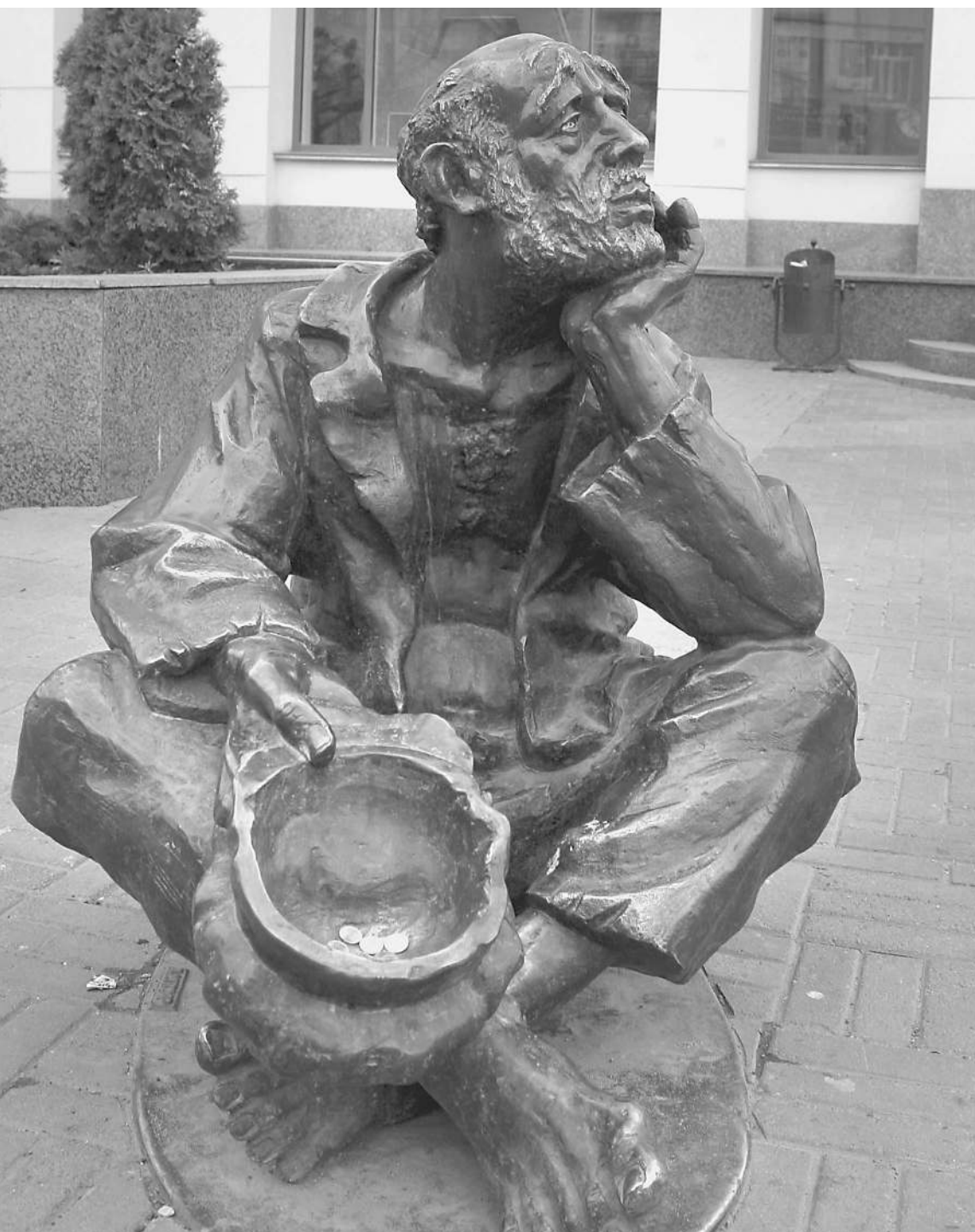
Банкиры, подайте измученному кризисом предпринимателю на спасение бизнеса. На снимке скульптура нищего у здания «Альфа-Банка» в Челябинске

«Известия» узнали у предпринимателей, легко ли получить государственную помощь