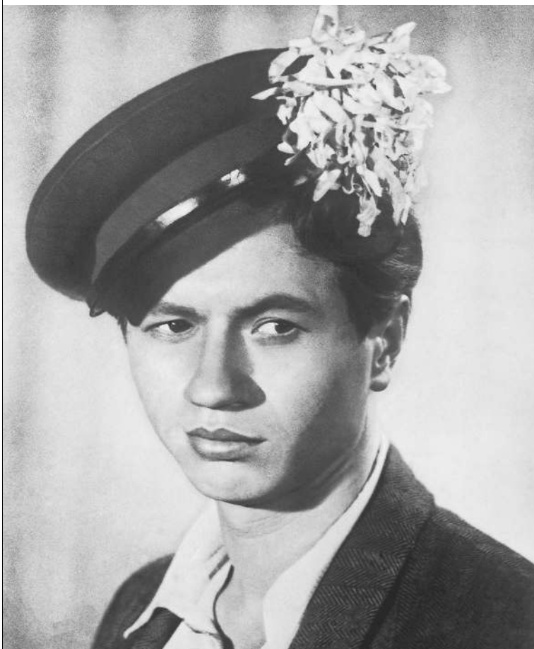
МАКСИМ ПЕРЕПЕЛИЦА — одна из первых звездных ролей Леонида Быкова

дет артистом: «Он ставил домашние спектакли «По щучьему велению», «Таня-революционерка», а мы все готовили ему костюмы, реквизит, продавали билеты, чтоб на эти несколько рублей угостить зрителей печеньем и лимонадом». → стр. 10