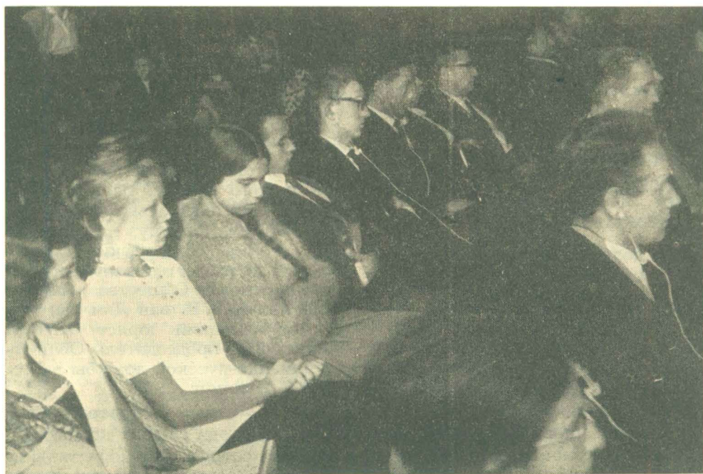
Молодые участники конференции слушают доклад.

Открыв конференцию, В. Я. Горачек предоставил слово для доклада «Народ в борьбе» Е. Р. Романову.