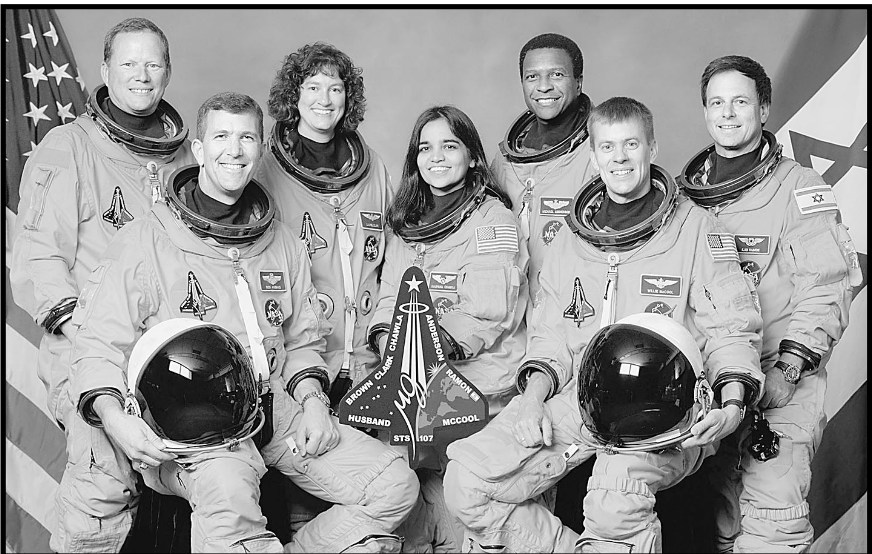
Экипаж космического корабля «Колумбия» (слева направо): Дэвид Браун, Рик Хазбенд (командир), Лорел Кларк, Калпана Чавла, Майкл Андерсон, Уильям Маккул, Илан Рамон

Итак, ради чего же рискуют космонавты? В эпоху первопродовцев Юрия Гагарина и Джона