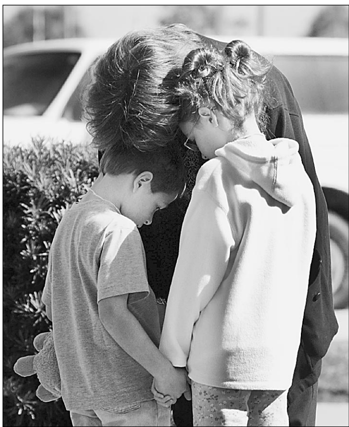
3 февраля. США. Флорида. Мемориал астронавтов. Америка скорбит

удается найти ни единой причины, которая оправдала бы пребывание человека на орбите. Это пребывание стоит огромных денег — один только запуск «шаттла» обходится в 500 млн. долларов. (Между прочим, примерно такую сумму Буш обещал по горячим следам «подбросить» НАСА.) И риск пребывания очень велик — где-то в верхних слоях самых опасных профессий. Из 113 стартов «шаттлов» два закончились аварией. При такой статистике в автотранспорте водитель, который ежедневно пользуется машиной, не прожил бы и месяца.