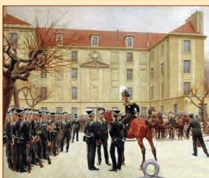
Гвардейский экипаж в Париже в 1814 г. Художник И.С. Розен, 1911 г. Центральный военно-морской музей, С.-Петербург