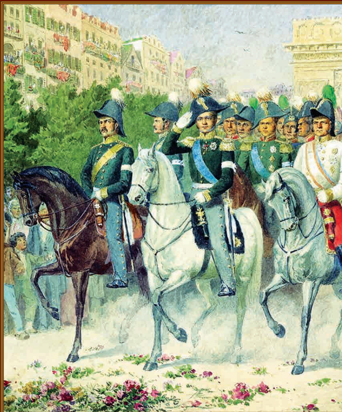
Вступление русских войск в Париж в 1814 году. Фрагмент картины художника А.Д. Кившенко, 1880 г.

200 лет назад — 31 (19 по ст.ст.) марта 1814 года — Русская армия во главе с императором Александром I триумфально вступила в Париж