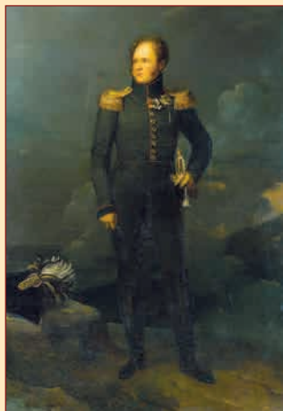
Портрет Александра I ▲ Художник Ф.П.С. Жерар. Около 1817 г. Государственный Эрмитаж