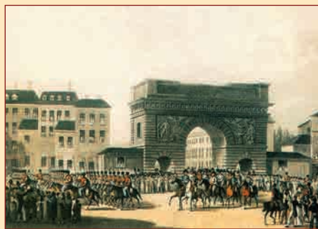
Вступление русских войск в Париж 31 марта 1814 г. Неизвестный художник