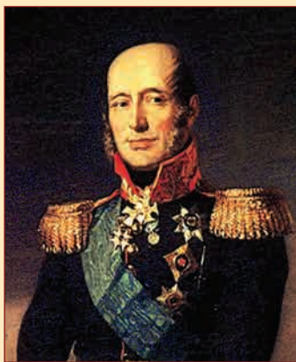
М.Б. Барклай-де-Толли Художник Д. Доу