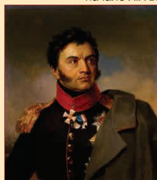
▲ Н.Н. Раевский Художник Д. Доу