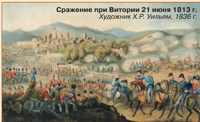
Сражение при Витории 21 июня 1813 г. Художник Х.Р. Уильям, 1836 г.