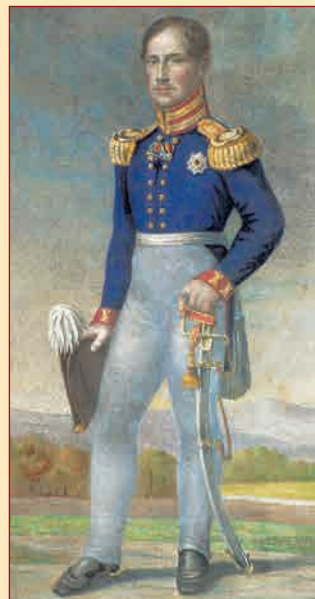
▲ Портрет Фридриха-Вильгельма III Художник Э. Гебауэр, начало XIX в.