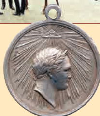
Медаль «За взятие Парижа»