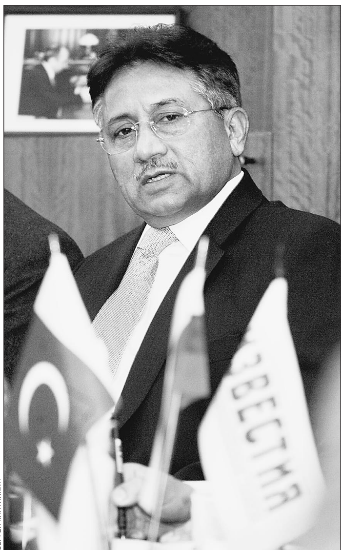
6 февраля. Первез Мушарраф в «Известиях»