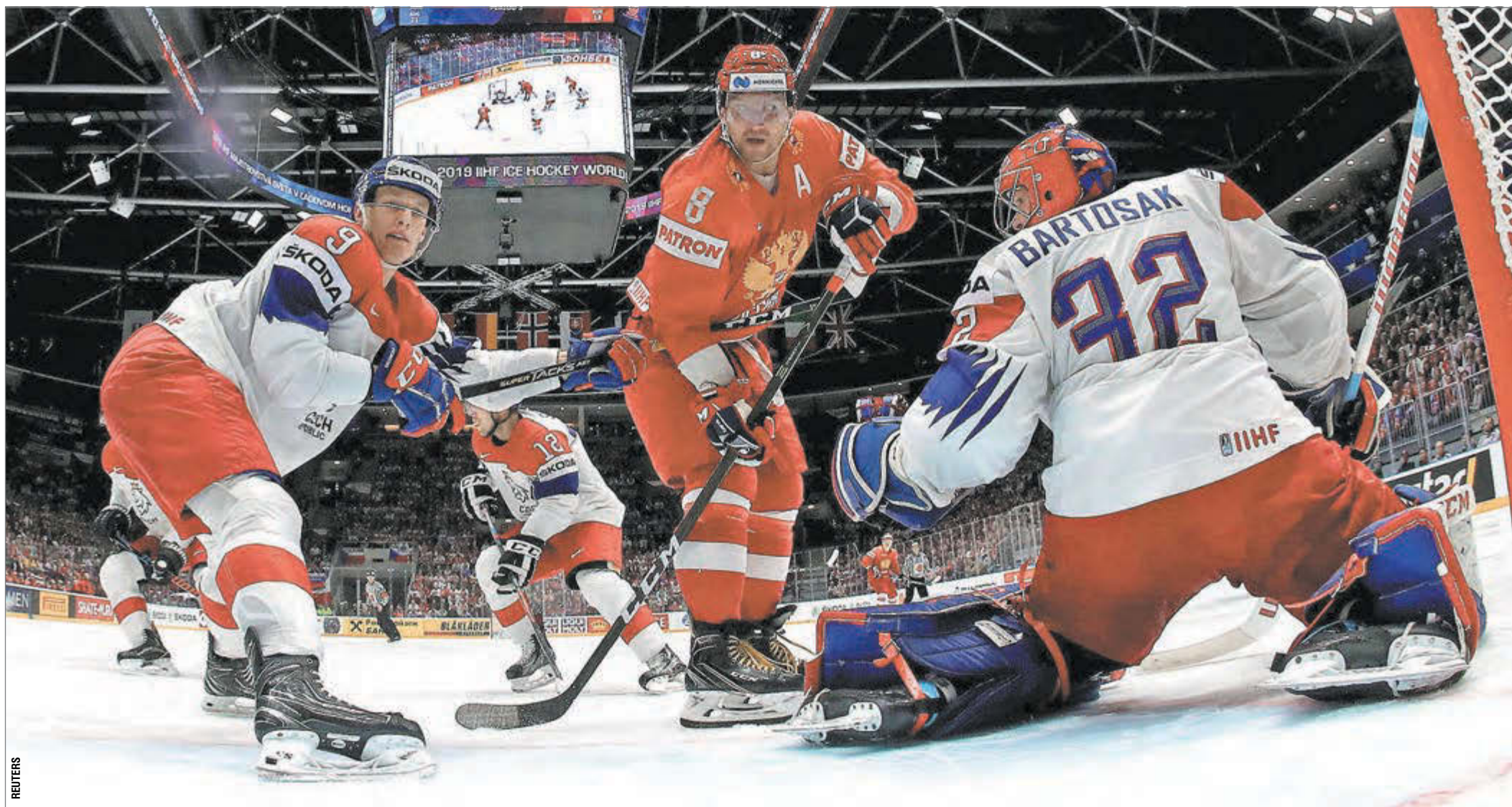
Вчера. Братислава. Россия - Чехия - 3:0. В атаке Александр ОВЕЧКИН.