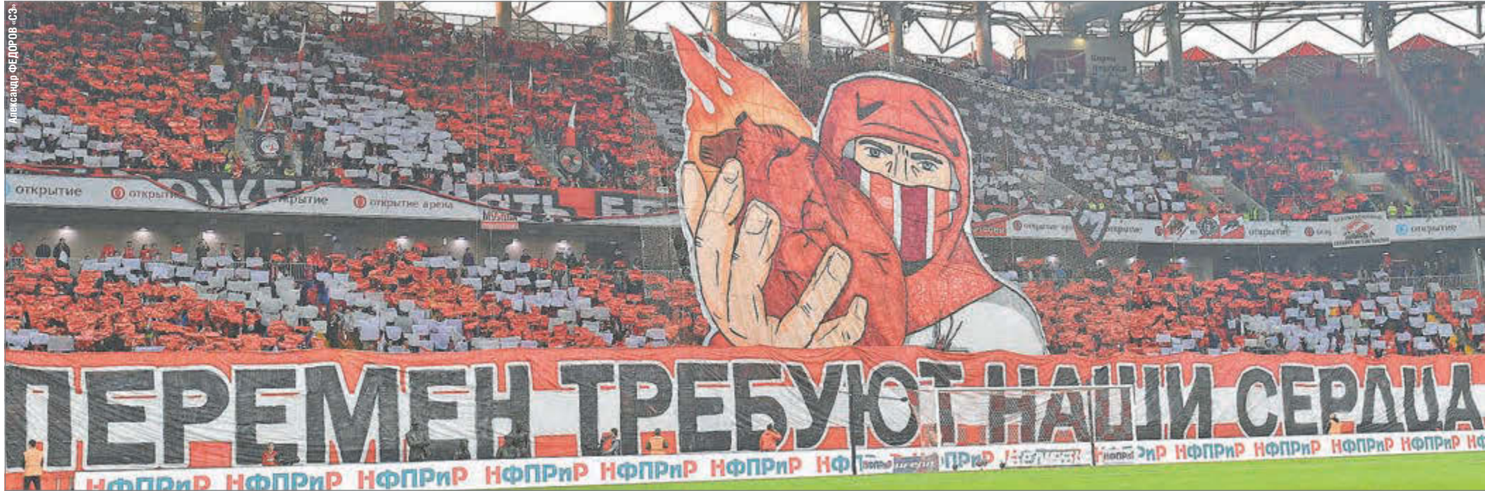
21 апреля. Москва. Тушино. «Спартак» - «Енисей» - 2:0. Перформанс болельщиков красно-белых.

Сегодня в Москве состоится совдир красно-белых, на котором ожидается принятие ряда важных решений о будущем клуба