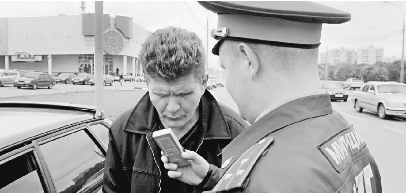
Подчас главным становится не вопрос о содержании алкоголя в организме, а правильность процедуры освидетельствования

С 0,3 промилле автомобилисты жили два года. Такую норму содержания допустимого уровня алкоголя в России ввели с 1 июля 2008 года. Тогда вступили в силу «автомобильные поправки» в Кодекс об административных правонарушениях, которые установили, что содержание алкоголя в организме водителя не должно превышать 0,3 промилле. Этот уровень ввели с поправкой на эндокринный алкоголь в организме человека, а также на квас, кефир и лекарства, которые может употреблять води-