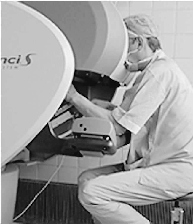
«Виртуальный хирург» избавит пациентов от врачебных ошибок