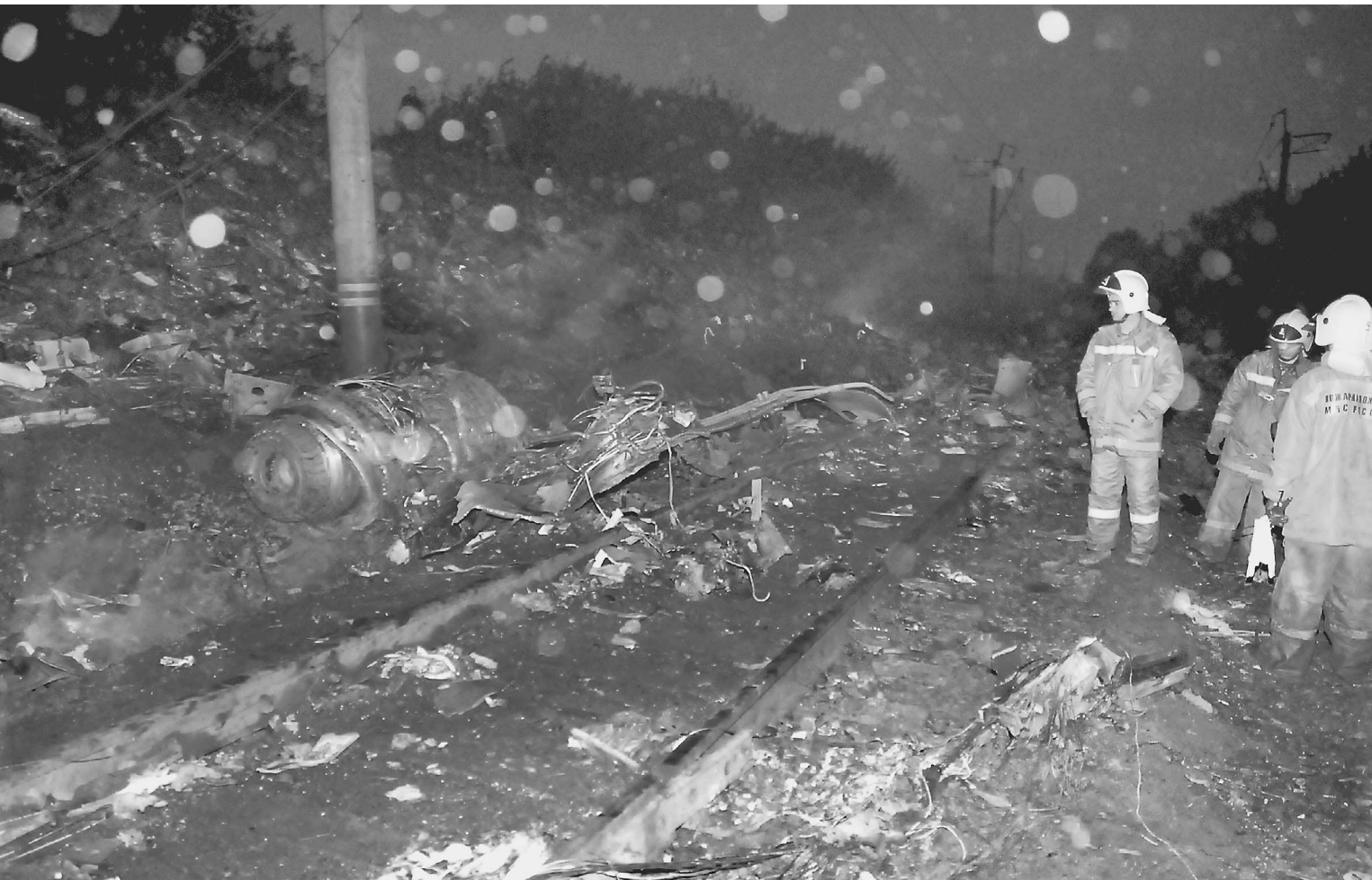
Двигатель разбившегося «Боинга». По одной из версий, он стал причиной крушения

По версии «Известий», он не хотел подставить под удар компанию, надеясь, что все обойдется