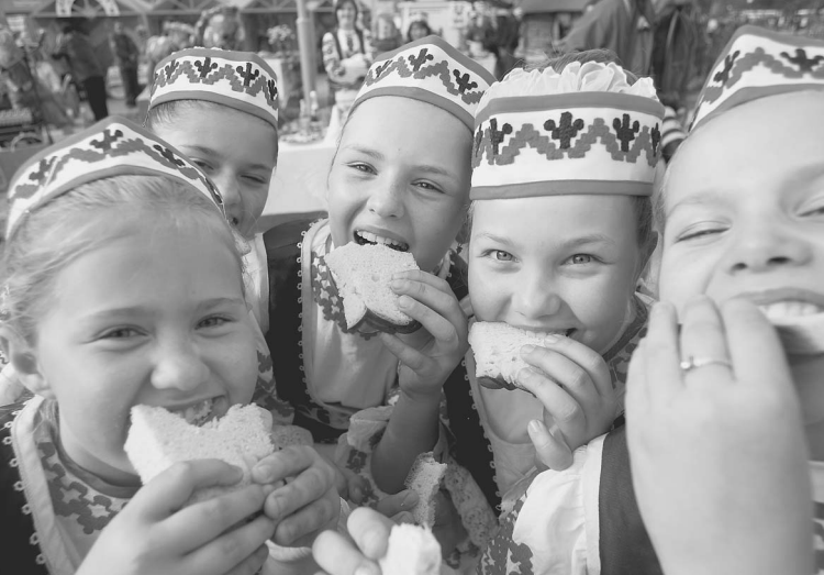
Весело и сытно живет гражданам союзного государства

Бизнесмен улыбнулся звериным оскалом капитализма, посмотрел на свои дорогие часы и повел меня в цех — раскрыть секрет успеха своего бизнеса. Рентабельность — 30% (в российской промышленности в среднем — менее 3%). Объем производства ежегодно удваивается. Причина — не только строительный бум, но и льготы государства, поскольку он открыл производство в малом городе. Освободили от налога на оборот в размере 2%, от половины налога на прибыль, дали льготы по налогу на недвижимость и на землю. → стр. 7