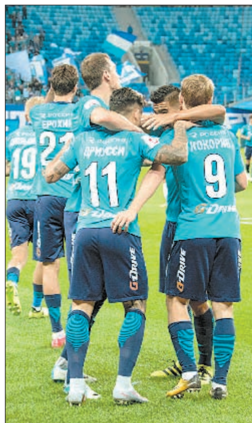
Вчера. Санкт-Петербург. «Зенит» - «Уфа» - 3:0. Питерский клуб - безоговорочный лидер чемпионата.