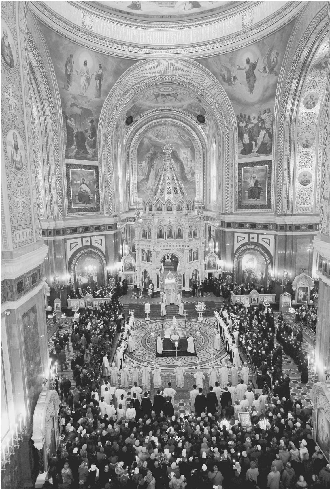
Москва. Храм Христа Спасителя. За упокой души Алексия II молились круглосуточно

Сегодня Россия простится с Патриархом Московским и всея Руси Алексием II. Почтить его память в Москву съехались представители православных Церквей, а также религиозные деятели иных конфессий. Ожидается прибытие лидеров Сербии и Молдавии Бориса Тадича и Владимира Воронина. Президент России Дмитрий Медведев предложил сегодня отменить развлекательные мероприятия, а мэр Москвы Юрий Лужков распорядился отключить новую иллюминацию.