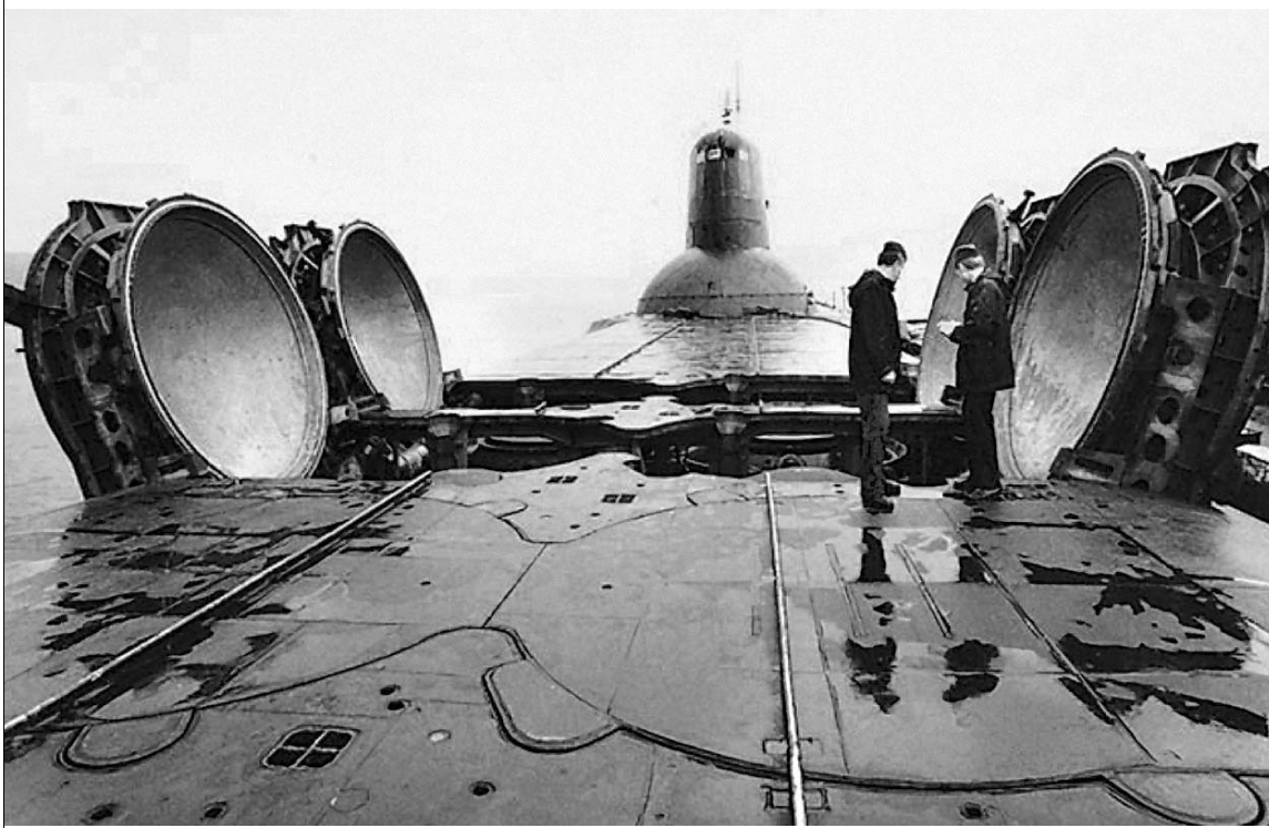
Пусковые люки атомного крейсера «Юрий Долгорукий» готовы принять 16 межконтинентальных ракет «Булава»

Недавняя авария на атомной подводной лодке на Дальнем Востоке привлекла внимание к проблемам российского флота. Это тем более важно, что при всех стократ оплаканных бедах Российской армии атомные субмарины — тот вид вооружения, который остается лучшим в мире и обеспечивает стране стратегический паритет в любом противостоянии с потенциальным противником. И высокая засекреченность объектов, где производятся ключевые элементы атомного флота, вполне оправдана. Тем не менее корреспонденту «Известий» Сергею Лескову удалось побывать в КБ, где проектируют реакторы для лучших в мире атомных субмарин и надводных судов. → стр. 9