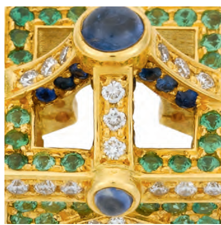
Между элегантностью и модой Светлые тона и воздушные фактуры