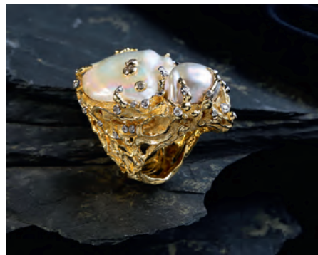
Единственные и неповторимые Ювелирный бренд Cuellar Design