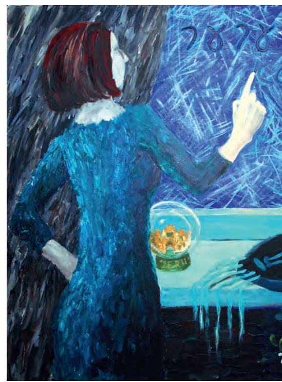
Невидимые нити Связь с мистикой: женская версия