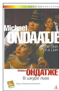
Ондатже М. В шкуре льва: Роман / Пер. с англ. Н.Кротовской. СПб.: Азбука, Азбука-Аттикус, 2011. — 288 с.

5 Этого канадского поэта и прозаика знают по фильму «Английский пациент». «В шкуре льва», который Майкл Ондатже написал раньше, в 1987-м, действие происходит в 1920-х годах в Торонто, а один из главных героев — отец медсестры Ханы. И это тоже история любви, тонкая, запутанная и несомненная проза.