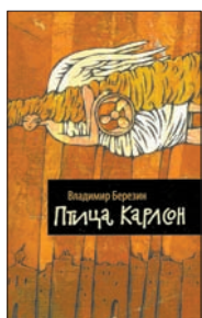
Березин В. Птица Карлсон. М.: АСТ, Астрель; Владимир: ВКТ, 2010. — 320 с.

4 Эту книгу называют «собранием пародий». Это не пародии, это стилизации — отчасти под постмодернизм, отчасти под «сетевую литературу». Всем известный Карлсон, порождение Астрид Линдгрен, становится у Березина персонажем произведений мировой литературы, от Достоевского до Толкиена. И это бывает ужасно смешно, а бывает и страшно. Как, собственно, и всегда в той самой литературе.