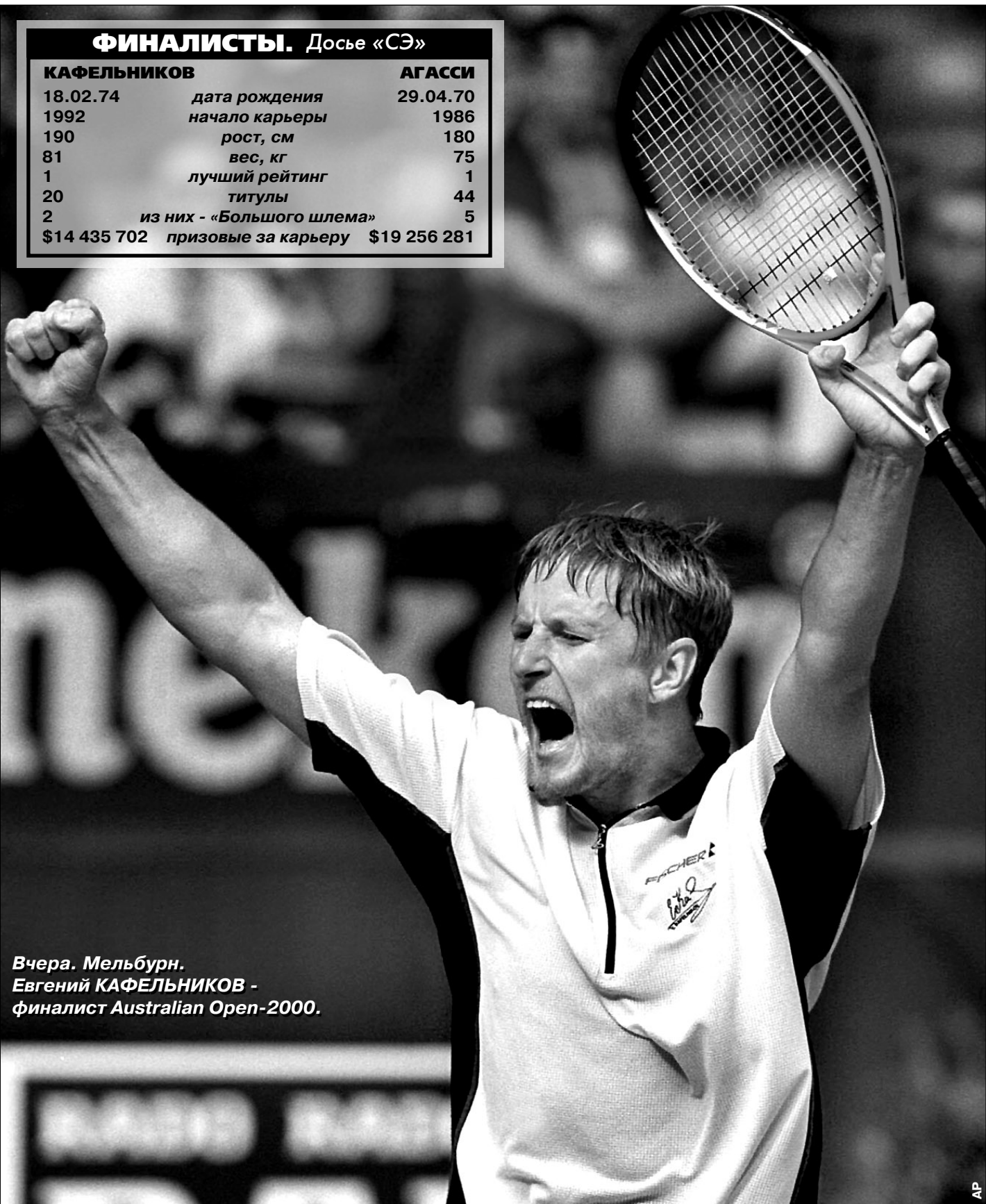
Вчера, Мельбурн. Евгений КАФЕЛЬНИКОВ — финалист Australian Open-2000.